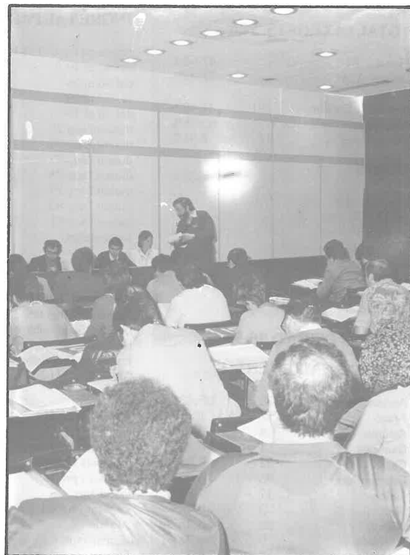
Los delegados trabajaron a tope en las comisiones