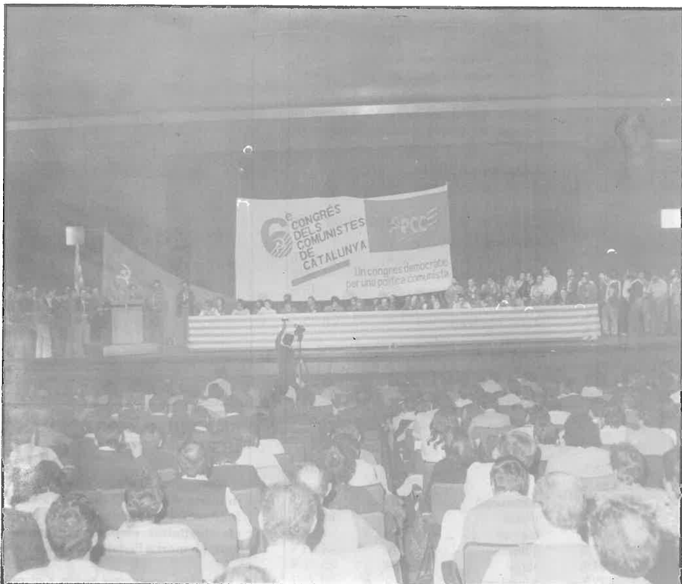
Aspecto parcial que ofrecía la sala de plenos en el momento de la presentación del Comité Central