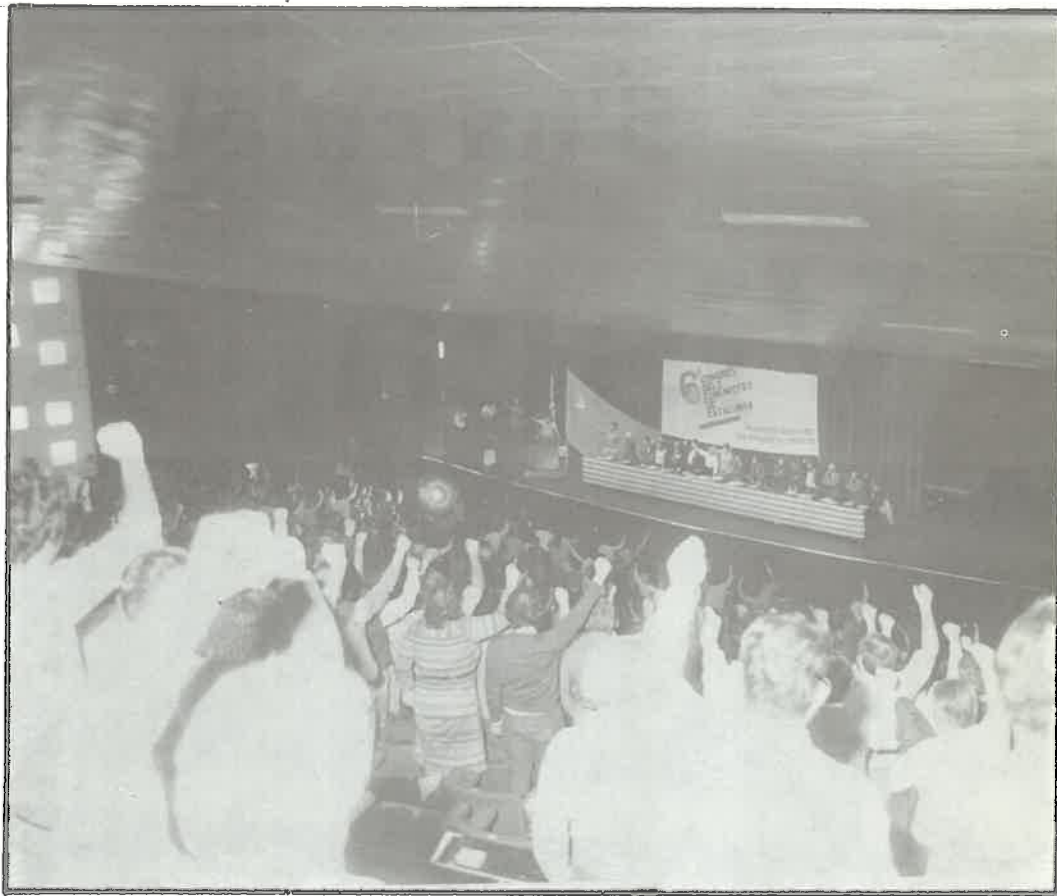
El entusiasmo de los congresistas había quedado olvidado. El VI Congreso lo recuperó.

Se van leyendo comunicados de los diferentes grupos políticos, sindicatos, cooperativas, etc. que están presentes en el Congreso en calidad de observadores: ERC, MCC, LCR, Nacionalistes d'Esquerra, PCEU, PCEU-Partit Comunista de Catalunya, SLMM, ATAC, CIEMEN, todos ellos entre