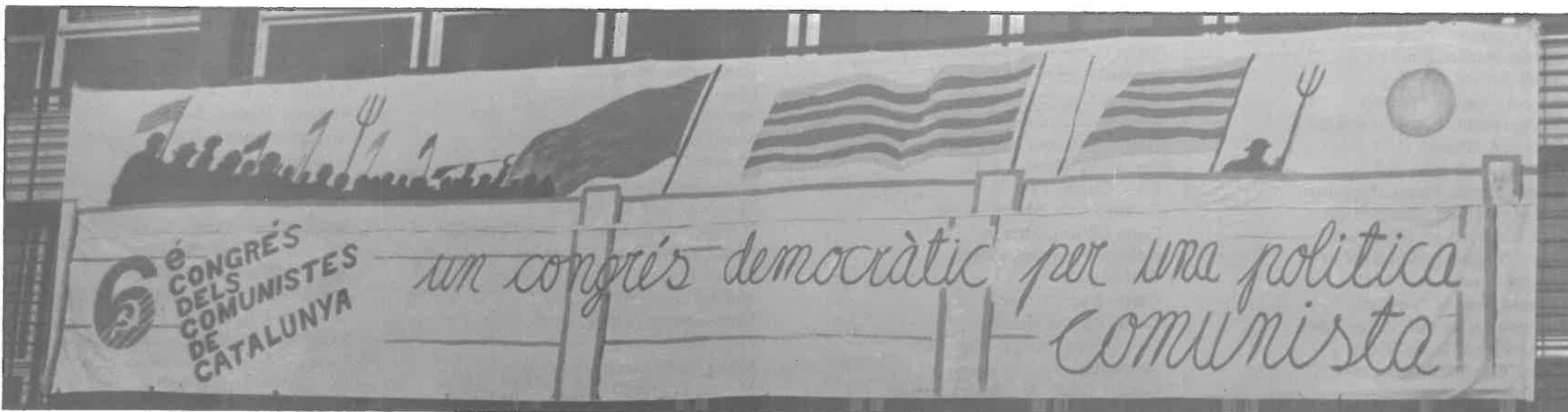
Esta pancarta presidió, durante cuatro días, la entrada al Palació de Congressos de Montjuic