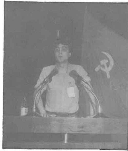
las diferentes nacionalidades y regiones del Estado Español.

Necesitamos un partido que contemple un tratamiento de la cuestión nacional que se plasme en la voluntad de desarrollar el principio leninista del derecho a la autodeterminación de los pueblos y que dé un contenido de clase al proceso autonómico en