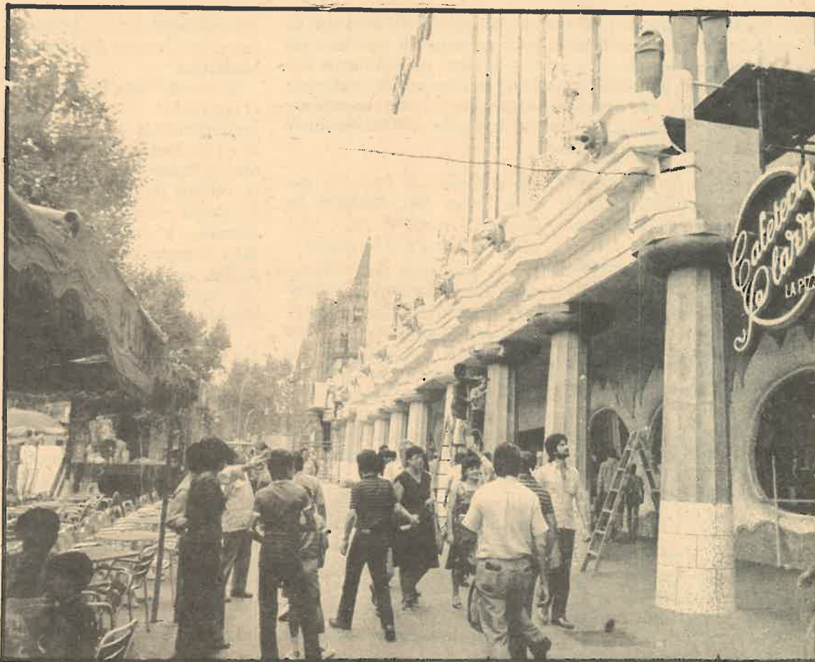
El «Tall Anglès» ha rebaixat Gaudí a la categoria d'aparador.

tan generosament repartiu, també podria catalanitzar el nom de la Westinghouse, per exemple), com deia, tan aviat la vaig veure vaig cridar. «Ostres! Ja s'estan preparant per pulir-se la Sagrada Família o el Parc Güell. Els posaran a la secció de rebaixes o a la de novetats?» Però no. Després de molt pensar vaig adonar-me'n que l'operació no era la clàssica mercantil-cultural (aquestes les monten a la Virreina o al Palau Macaya quan l'autor es mort o a qualsevol galeria plena de llustre progressista si aquest es viu), sinó una vulgar, però no menys clàssica, operació patriótico-mercantil, en la que el bona fé del Sr. Gaudí fa el paper de convidat de pedra (en aquest cas més aviat de cartró pedra). S'acostava l'Onze de Setembre! I encara sort que no en van disfressar els venedors amb espadanya, barretina i la catalana brusa que han reinventat entre el mossèn i el sastre de Vic. Ara cal esperar que pel Dia de la Raza (altrament dit de La Hispanidad), la fantàsica façana neogaudiniana no es transformi en ferrenyament neoherrerista i aquells qui gosin d'entrar ho facin amb la por de trobar-se al mateix Felip II darrera d'un mostrador. No es previsible, però. A la nostra «región autónoma» l'Escorial no te la força mercantil que pot