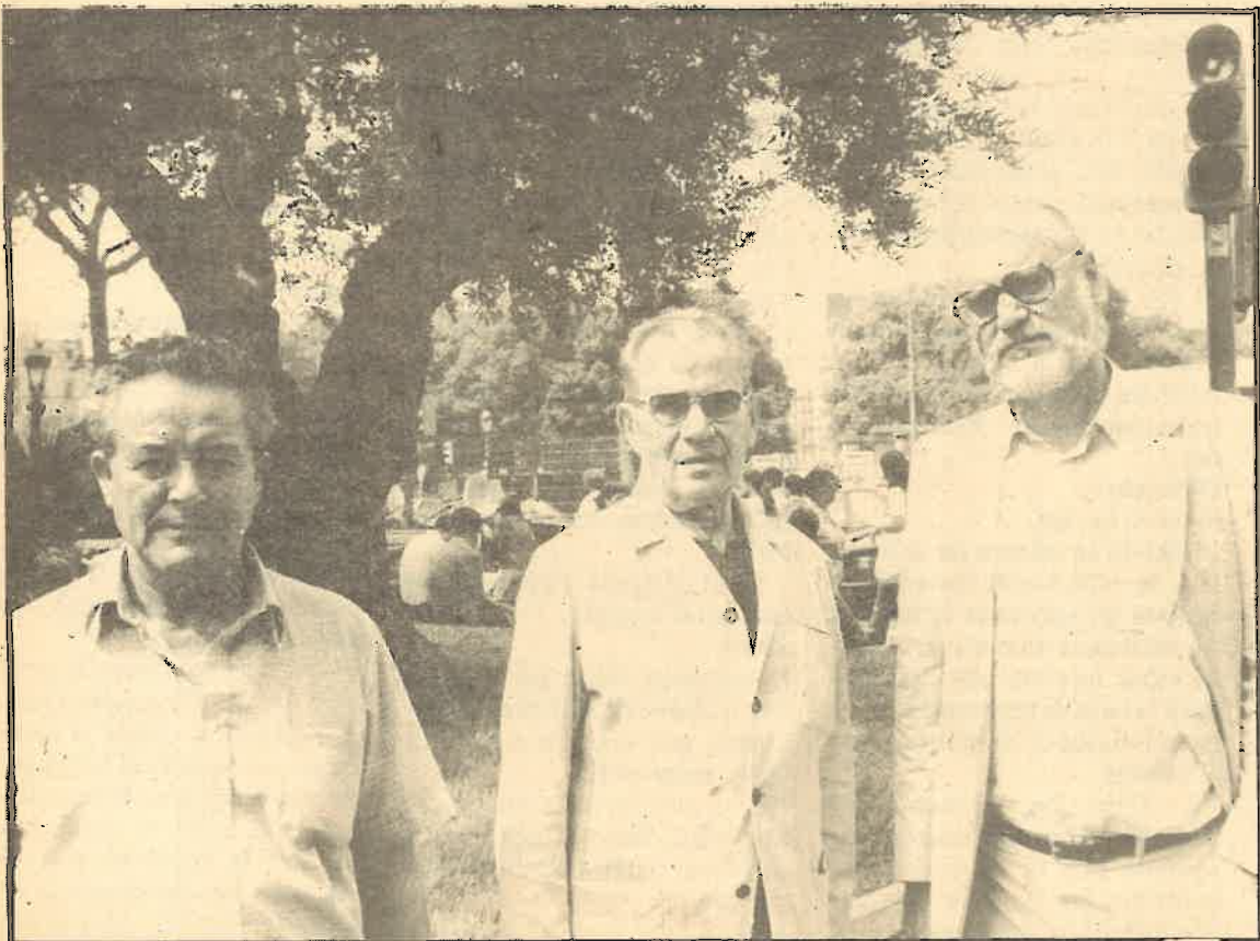
Los tres «del Senado»

El segundo horizonte se corresponde con la etapa que calificamos de democracia política y económica. En dicha etapa se contemplan medidas tales como la nacionalización de la banca, entidades financieras, monopolios, control de las multinacionales, reforma agraria, democratización de los aparatos del Estado, etc. con lo que se sientan las bases para un primer esbozo de cambio de la estructura política y económica