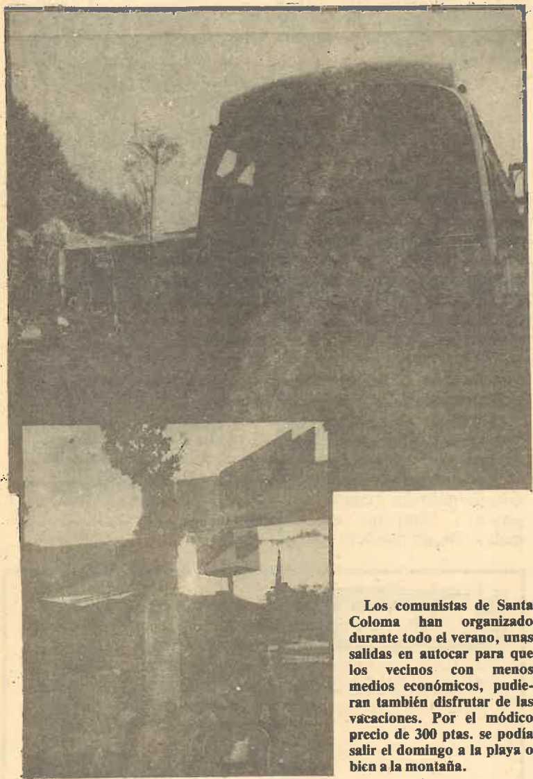
Los comunistas de Santa Coloma han organizado durante todo el verano, unas salidas en autocar para que los vecinos con menos medios económicos, pudieran también disfrutar de las vacaciones. Por el módico precio de 300 ptas. se podía salir el domingo a la playa o bien a la montaña.