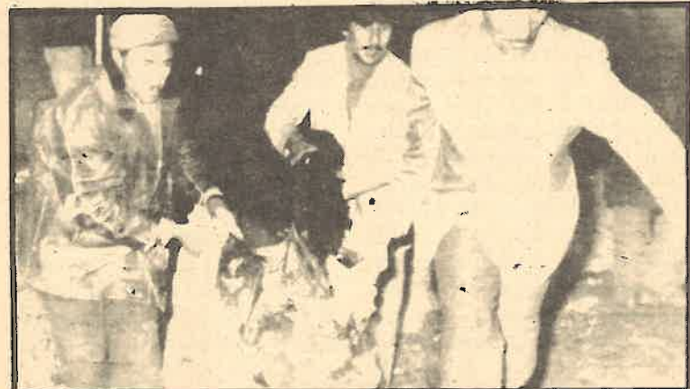
Escenas como ésta en los medios de comunicación nos habitúan a la violencia.

Evidentemente a medida que nos sumergen en este tipo de alienación cultural, la violencia deja de existir como tal y entonces todas las intervenciones norteamericanas en otros países, sean armadas o económicas, son un bien para la civilización y la democracia.