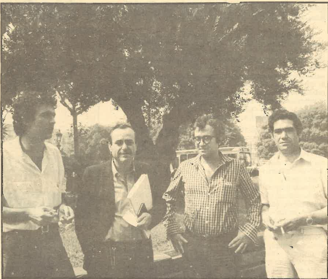
Cuatro para el Congreso por Barcelona

El Comité Central del PCC valora la imposibilidad de que el deseo de cambio que hoy expresan las más amplias capas populares pueda realizarse, pueda concretarse en transfor-