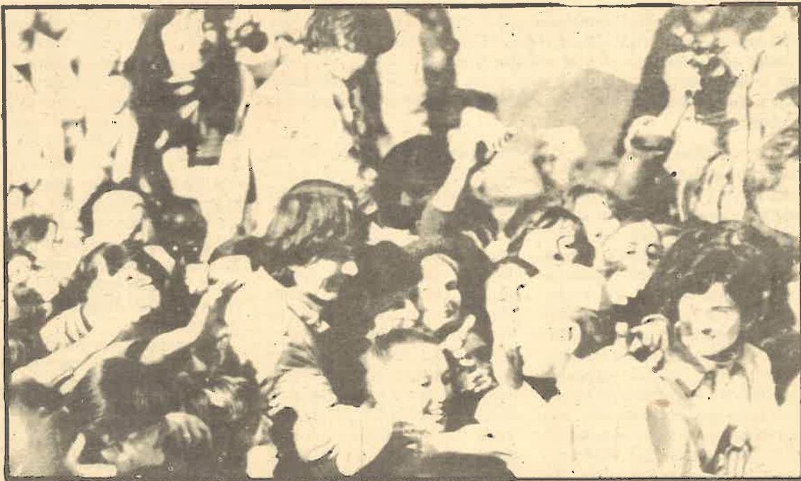
Las dos caras del Papa: la popular y la oculta, el Opus.

Esta capacidad de adaptación y comprensión ha producido fenómenos totalmente opuestos en el seno de la Compañía de Jesús. Por un lado el famoso «jesuitismo», especie de maquiavelismo, que no es más que la habilidad camaleónica para la adaptación superficial, formal, que posibilite mayor rentabilidad y eficacia en las acciones, pero conservando las esencias conservadoras y reaccionarias. Pero por otro lado ha permitido la concienciación de un importante número de jesuitas ante la explotación, y su incorporación más o menos activa a organizaciones de izquierda y a proyectos revolucionarios. De ahí resulta su actividad en barrios obreros, en partidos de izquierda, en plataformas críticas de la Iglesia (como Cristianos por