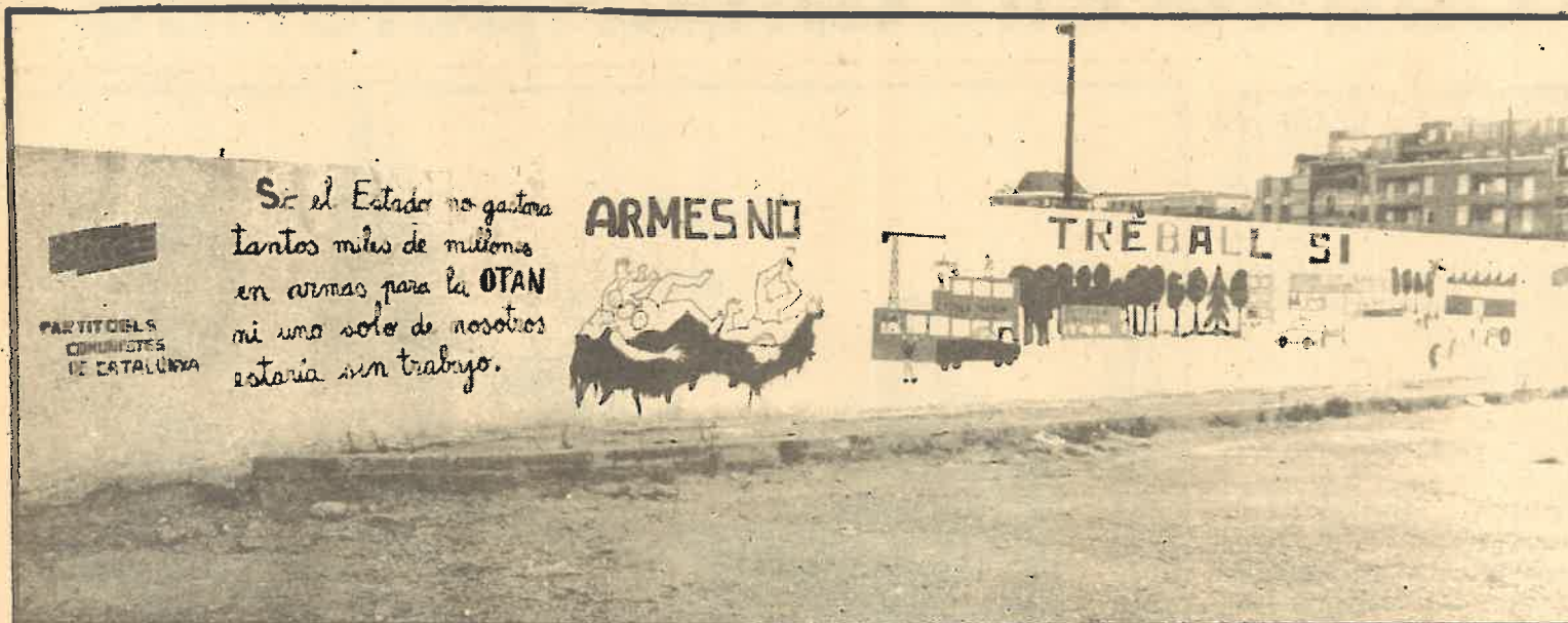
Los militantes de la agrupación de Prosperitat han obsequiado durante este verano a sus vecinos con un monumental mural, que refleja los temas que más

preocupan a los trabajadores: el paro y la lucha por la paz. Temas que están ligados estrechamente.