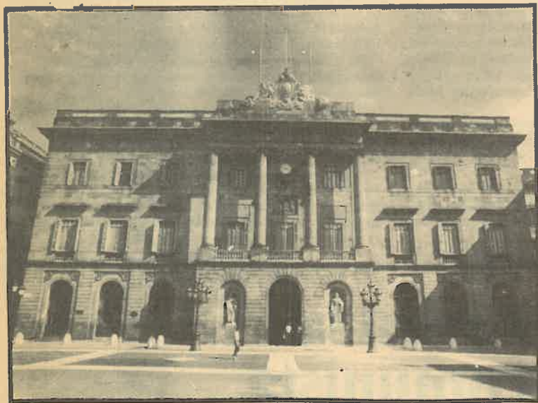
El proyecto de ley para las elecciones locales que prepara el PSOE pretende trasladar el bipartidismo a los ayuntamientos.