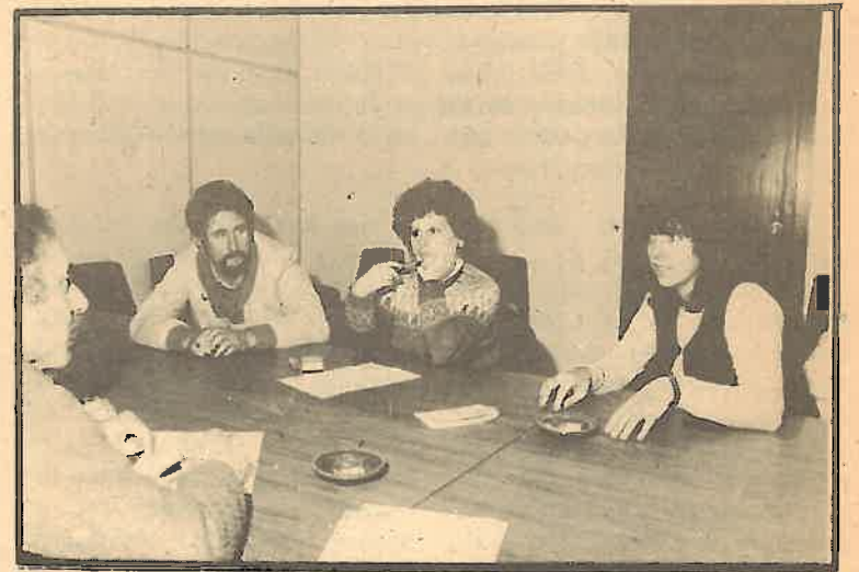
Tres líderes sindicales de Comisiones Obreras de la fábrica PIHER de Badalona.

Comisiones Obreras ha obtenido los 13 delegados elegidos en la empresa de alimentación Frigo, de Barcelona, que