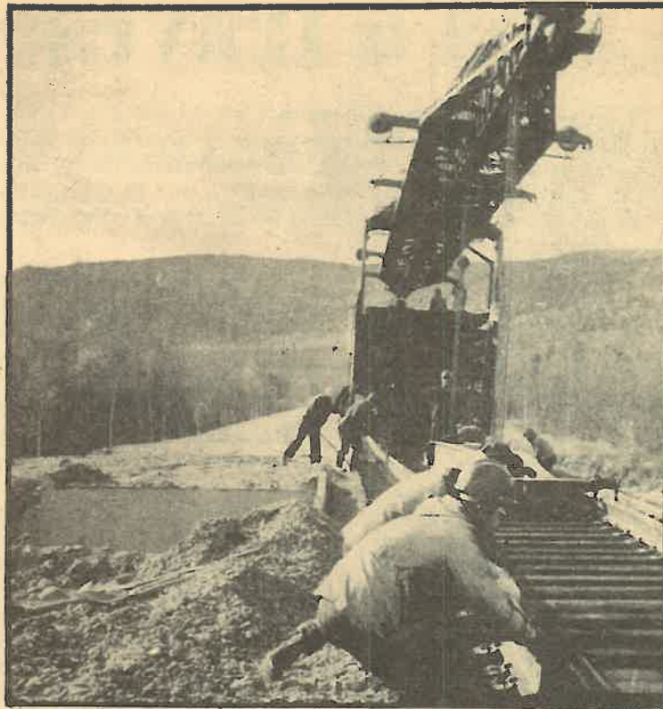
Aspecto de la construcción de un tramo del ferrocarril Baikal-Amur.

La modernización de la economía soviética y su transición a la vía del desarrollo intensivo ha requerido acelerar los ritmos de producción y cambios cualitativos en la industria de maquinaria. Ya ahora algunas ramas importantes de esta industria marchan a ritmos que superan en 2-3 veces el desarrollo industrial general del país. Se ha iniciado la modernización de las industrias del petróleo, del gas, la industria ligera, la industria. Se ha creado un sistema de máquinas para la mecanización integral de la construcción y el mejoramiento de terrenos, y se amplía la construcción de maquinaria agrícola. Economistas soviéticos