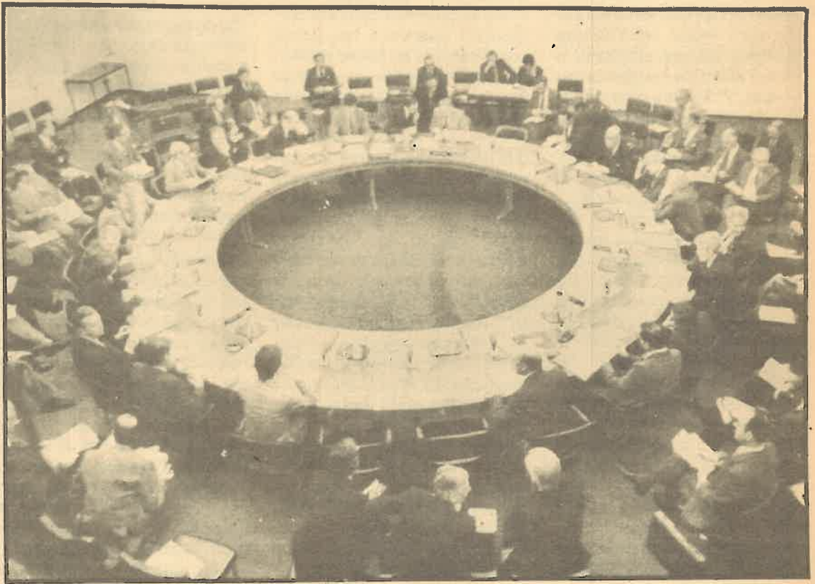
El PSOE está deshojando la margarita del ingreso o no de España en la organización militar de la OTAN.

Cuando a la firma del tratado de no proliferación de armas nucleares se le agrega la coletilla de que ello «no impida el necesario abastecimiento para España», y cuando a la posición de no dependencia en la relación bilateral se agrega que se tendrán en cuenta «intereses» más globales que los puramente defensivos de España, la credibilidad de la propuesta hace aguas. Nada dice Felipe de una clara opción antiimperialista. Por eso, aunque cabe esperar de las intenciones formuladas que realmente mejoren en lo político y en lo económico las relaciones con Latinoamérica, el aumento de la solidaridad con los pueblos latinoamericanos sometidos a dictaduras y las medidas de freno a cualquier intento de intervención en la amenazada Nicaragua, y en conjunto, toda Centroamérica deben incluirse en el «estudio» de las relaciones con USA. Porque es este el país imperialista que coloca los gobiernos títere que oprimen a los pueblos y el organizador de las guerras o amenazas de guerra en territorio latinoamericano. En lo económico, mucho habrá que cuidar de que España no sea el intermediario servil al