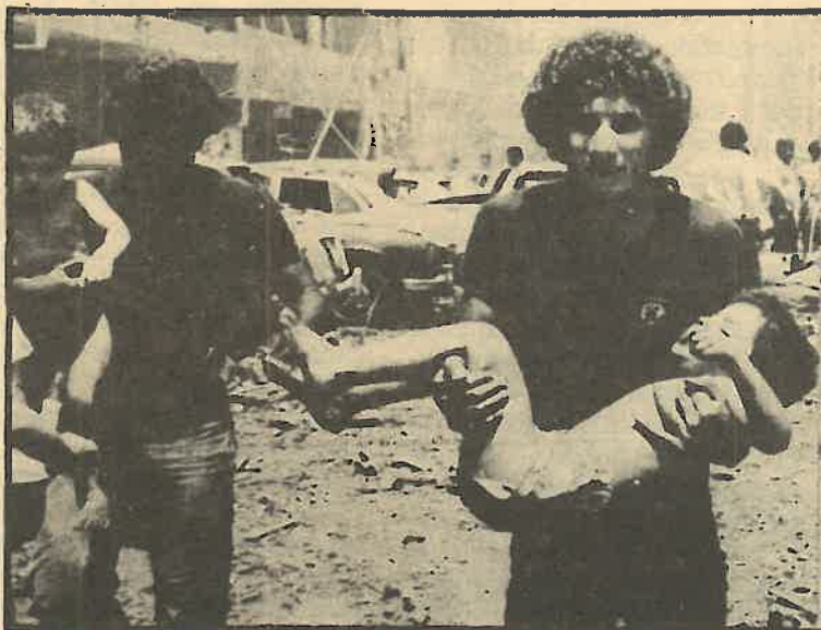
El pueblo palestino lleva más de treinta años huyendo de la matanza.

La aparente tranquilidad —por supuesto, entre atentado y atentado— noticable que reina en el Líbano desde el escándalo de las matanzas de Sabra y Chatila, no puede llamar a engaño: la represión contra el pueblo palestino sigue implacablemente.