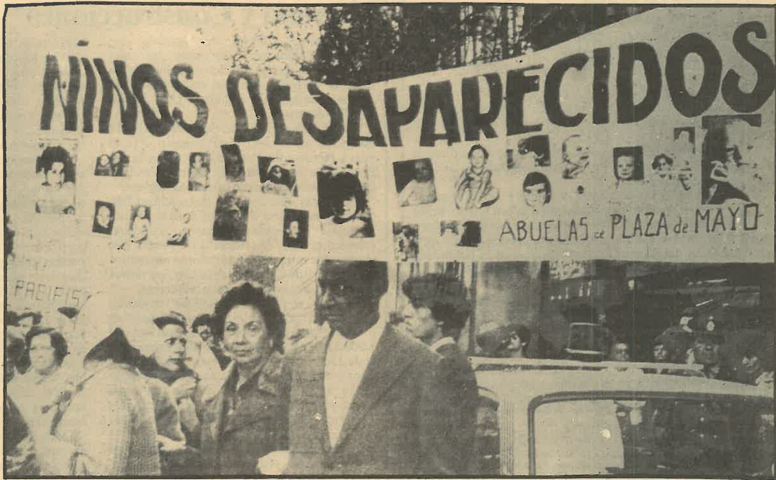
Las madres de la Plaza de Mayo seguirán reclamando a sus desaparecidos, pero su presencia en las calles de Buenos Aires durante años, no habrá sido estéril. Los dictadores se han quedado solos. Seis millones de huelguistas que paralizaron toda Argentina han sido la prueba de que los fascistas militares tienen los días contados.