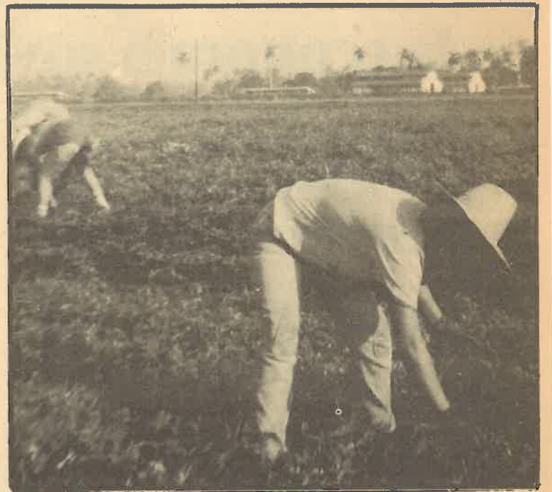
El trabajo en común en favor de la revolución cubana aproxima a las juventudes de todo el mundo.

La clausura fue a mi modo de entender más densa en contenido, ya que participaron como invitados, un grupo de