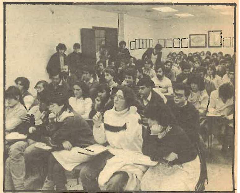
Un aspecto de la reunión de jóvenes comunistas en los locales del Comité Central del PCC.

Una vez leído el informe se pasó a su discusión, destacán-