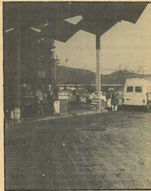
Recaudar fondos en base a impuestos indirectos es la solución más fácil

Pero no ha sido así. Se ha optado por el camino más fácil y el bolsillo más dócil y menos poderoso. Los de siempre vamos a ser los que en su inmensa mayoría pongamos —a nuestras costas— el primer parche del Gobierno del PSOE. Tanto los que votaron PSOE convencidos, como los que votaron «útil»... como los que no les votamos.