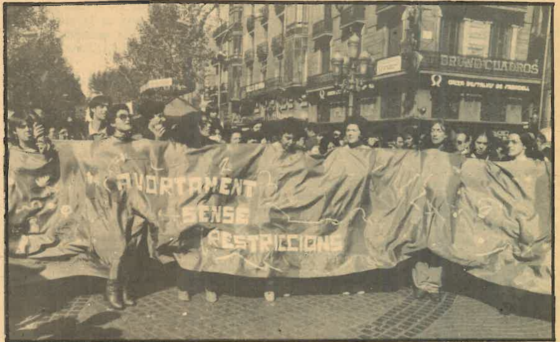
Las mujeres progresistas se manifiestan por el derecho a disponer libremente de su propio cuerpo

Este no es un problema personal e intransferible de las