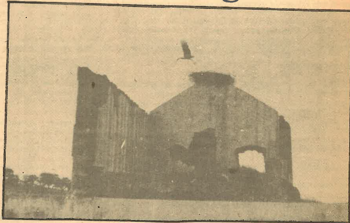
El patrimonio natural, artístico y arqueológico, una preocupación de las candidaturas de la APU.

Debe destacarse también la confirmación de la victoria alcanzada por APU en los municipios predominantemen-