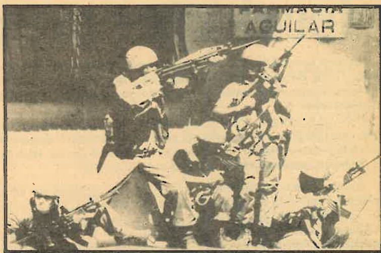
Armas, asesores, sueldos... La agresión imperialista no cesa

Los asesores argentinos portan credenciales de colaboradores de fuerzas especiales de seguridad que son el órgano de represión más brutal de Honduras. En Costa Rica convergen contra el sandinismo varias fuerzas políticas y económicas. En cuanto a operaciones de sabotaje y actos