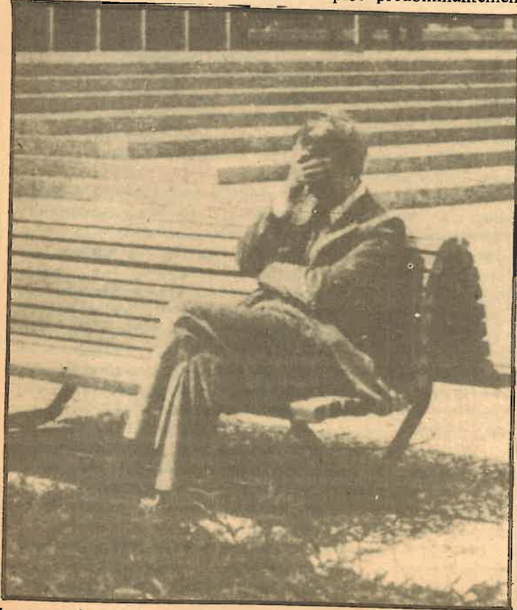
Los ayuntamientos de izquierdas potencian las inversiones para paliar el paro

APU fue la única coalición que no perdió ningún Ayuntamiento, y además vió reforzada su mayoría donde ya la tenía.