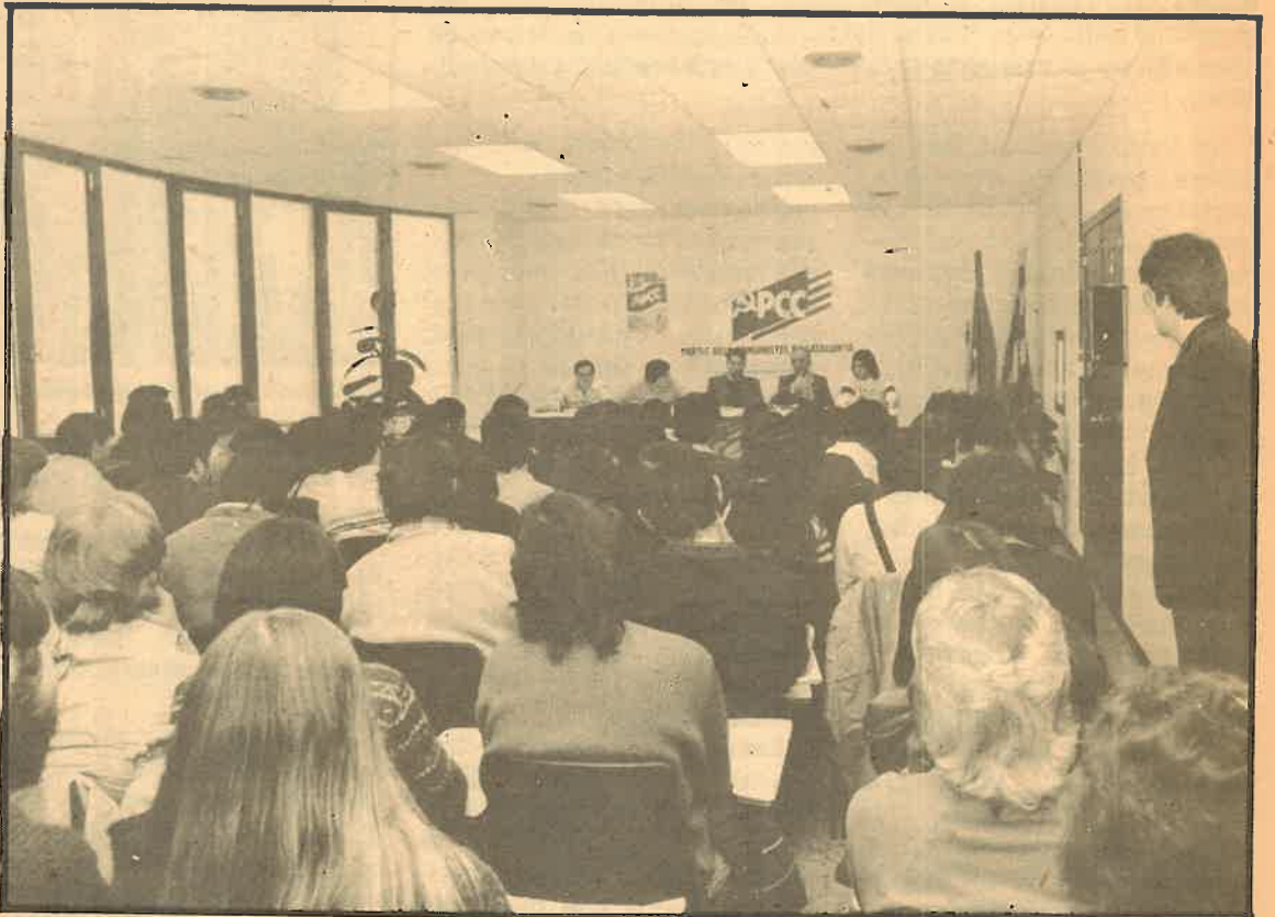
La juventud comunista, reunida con la dirección del PCC

Estas deben ser fraternales y de mutuo apoyo, entendiendo la especificidad del trabajo de cada organización,