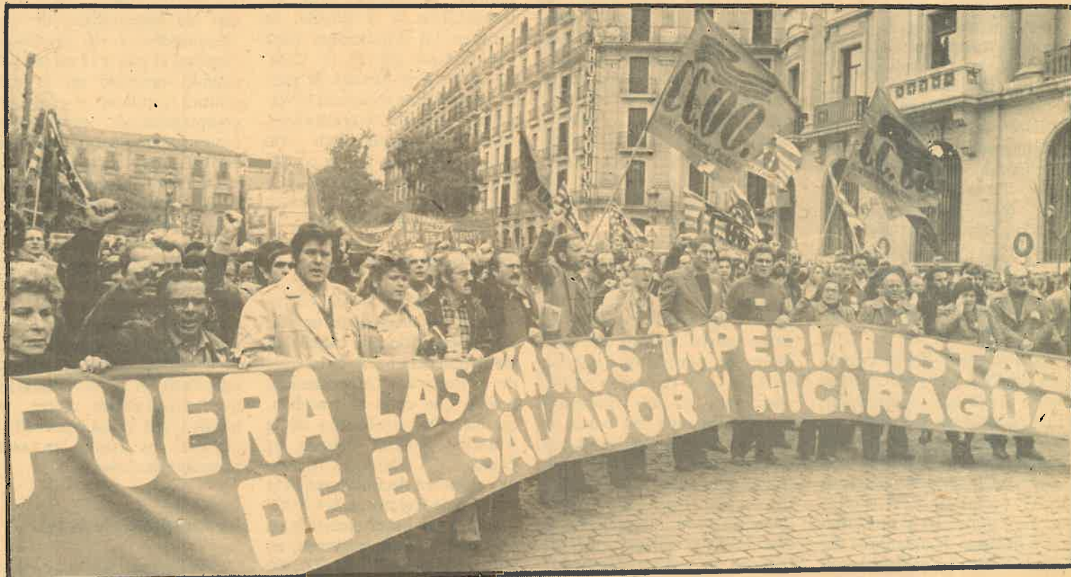
Manifestación en Barcelona contra la intervención norteamericana en El Salvador

Mientras en el mundo se suceden las manifestaciones por la paz, contra la carrera armamentista; mientras en Centroamérica los dictadores impuestos por el imperio continúan asesinando a los pueblos, Mr. Shultz, secretario de Estado de EE.U., viene a España. Y viene a España con la cartera repleta de asuntos y de exigen-