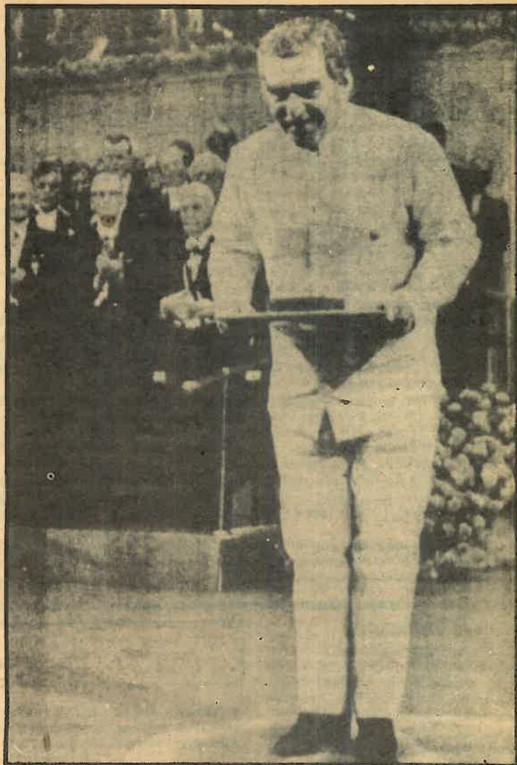
Han hablado más del traje que del contenido del discurso

ni tiene por qué ser un alfil sin albedrío, ni tiene nada de quimérico que sus designios de independencia y originalidad se conviertan en una aspiración occidental. No obstante, los progresos de la navegación, que han reducido tantas distancias entre nuestras américas y Europa, parecen haber aumentado en cambio nuestra distancia cultural. ¿Por qué la originalidad que se nos admite sin reservas en la literatura se nos niega con toda clase de suspicacias en nuestras tentativas tan difíciles de cambio social? ¿Por qué pensar que la justicia social que los europeos de avanzada tratan de imponer en sus países no puede ser también un objetivo latinoamericano con métodos distintos en condiciones diferentes? No: la violencia y el dolor desmesurados de nuestra historia son el resultado de injusticias seculares y amargas sin cuento, y no una confabulación urdida a 3.000 leguas de nuestra casa. Pero muchos dirigentes y pensadores europeos lo han creído, con el infantilismo de los abuelos que olvidaron las locuras fructíferas de su juventud.»