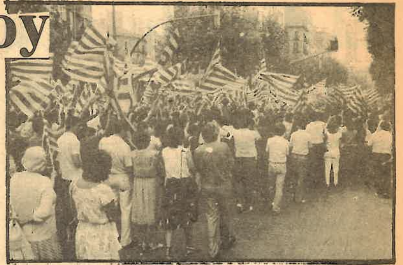
Organizar la militancia y revitalizar los movimientos de masas, tareas primordiales de los comunistas

El PCC es también resultado del repudio de esos métodos políticos y organizativos y