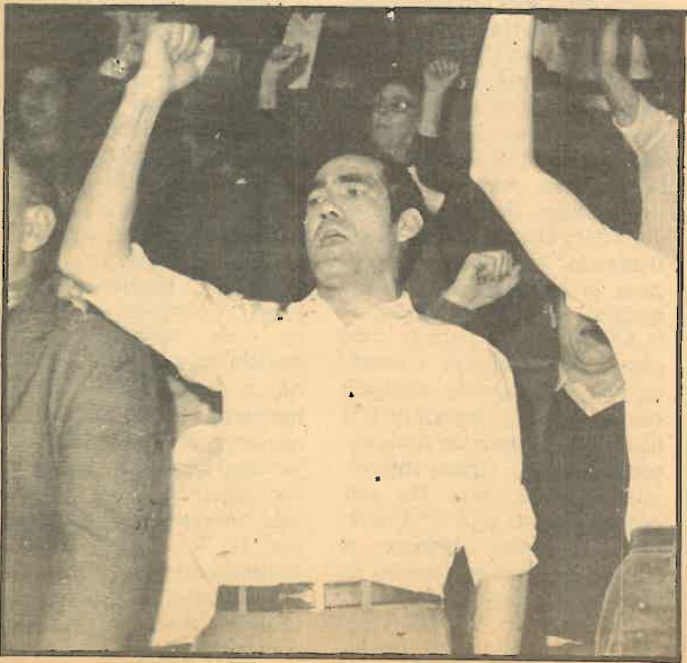
Justiniano es una voz popular.

— Porque aún suponiendo que el equipo de gobierno se hubiera esforzado, se está trabajando con los criterios de la “Gran Barcelona”. Y desde Barcelona se intenta gobernar a otras localidades, a las poblaciones del área metropolitana. Y es que únicamente se ve a la Barcelona tradicional, la