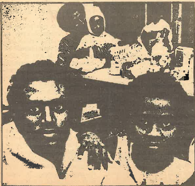
La pobreza también existe en los denominados «países ricos»

Esta es una cara de la cuestión. Hay otra, que no se cuenta nunca. También existen en estos países «pobres» —igual como en los países capitalistas desarrollados— una minoría rica. Según datos del BIRD (Banco Internacional para la Reconstrucción y el Desarrollo) referidos a un balance hecho en 1972 en 39 países subdesarrollados —el 5% de la población obtiene unas rentas 30 veces mayores que las rentas del 40% de la población, y aún mucho mayor que las rentas de la parte restante—.