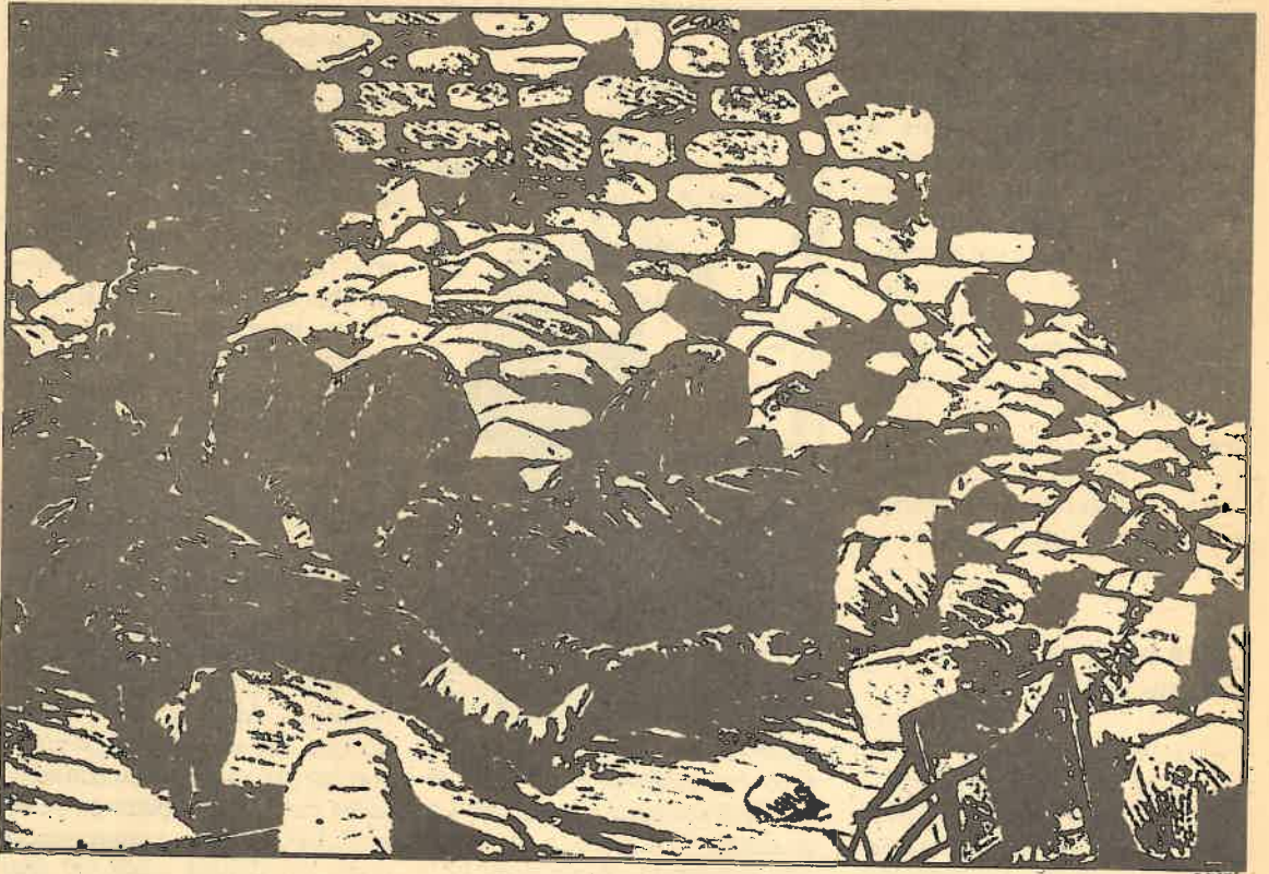
La Revolución del 48 fue el primer gran enfrentamiento armado entre la burguesía y el proletariado. Grabado de la época

En los demás países europeos, un devenir más confuso y menos acabado conduce a la formación de esa misma sociedad burguesa. A fines del primer período (1848-1871), período de tempestades y revoluciones, mueren el socialismo anterior a Marx. Nacen los partidos proletarios independientes: la Primera Internacional