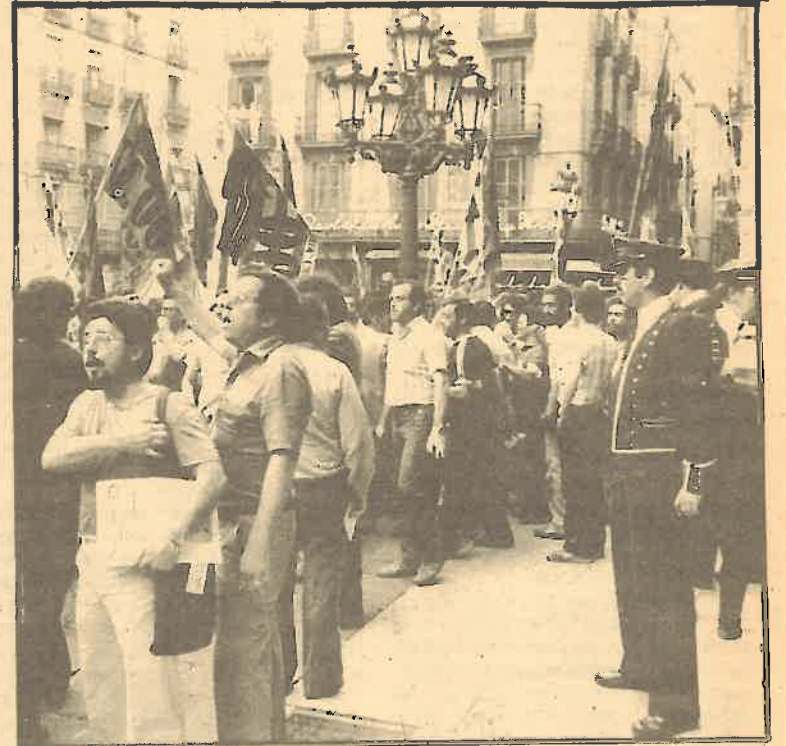
Los ciudadanos han de ser oídos en los ayuntamientos.

están tan enfrentados el Ayuntamiento y los trabajadores.