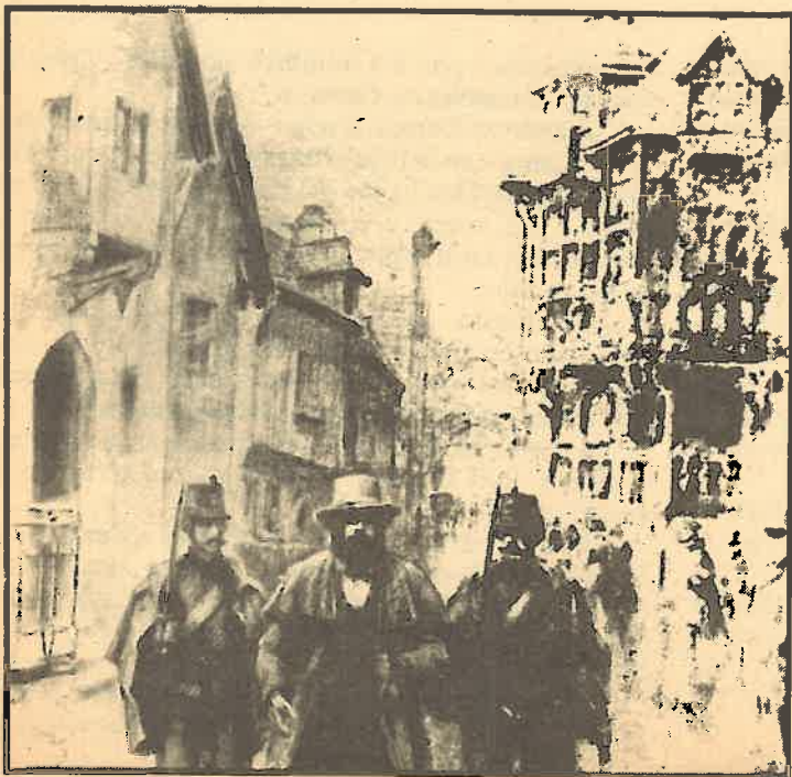
Detención de Marx en Bruselas. 1848