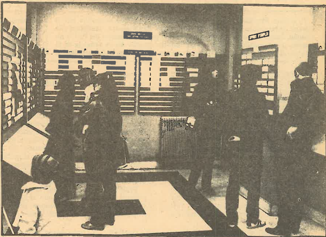
Diez millones de parados, fruto del dominio monopolista en la CEE

Buena parte de dichas empresas han podido mantener su existencia durante años y años por las barreras arancelarias, por la simple y pura imposibilidad de hacer determinadas importaciones, o por el grado de nacionalización exigido a determinados productos. La empresa catalana, en líneas generales, no alcanza los niveles de productividad de las empresas de la CEE. Pero ello se debe sobre todo a la inclinación del empresariado catalán de innovar relativamente poco, a "gastar" su maquinaria más allá de la obsolescencia, a invertir —mejor especular— en sectores como el inmobiliario. El hecho real es que nos encontramos en una situación en que no vamos a poder competir, salvo honrosas excepciones y carecemos de un mercado articulado propio. No estamos ahorrando, ni mucho menos los años de la autarquía. Todo lo contrario. Pero el desequilibrado crecimiento de los sesenta y la