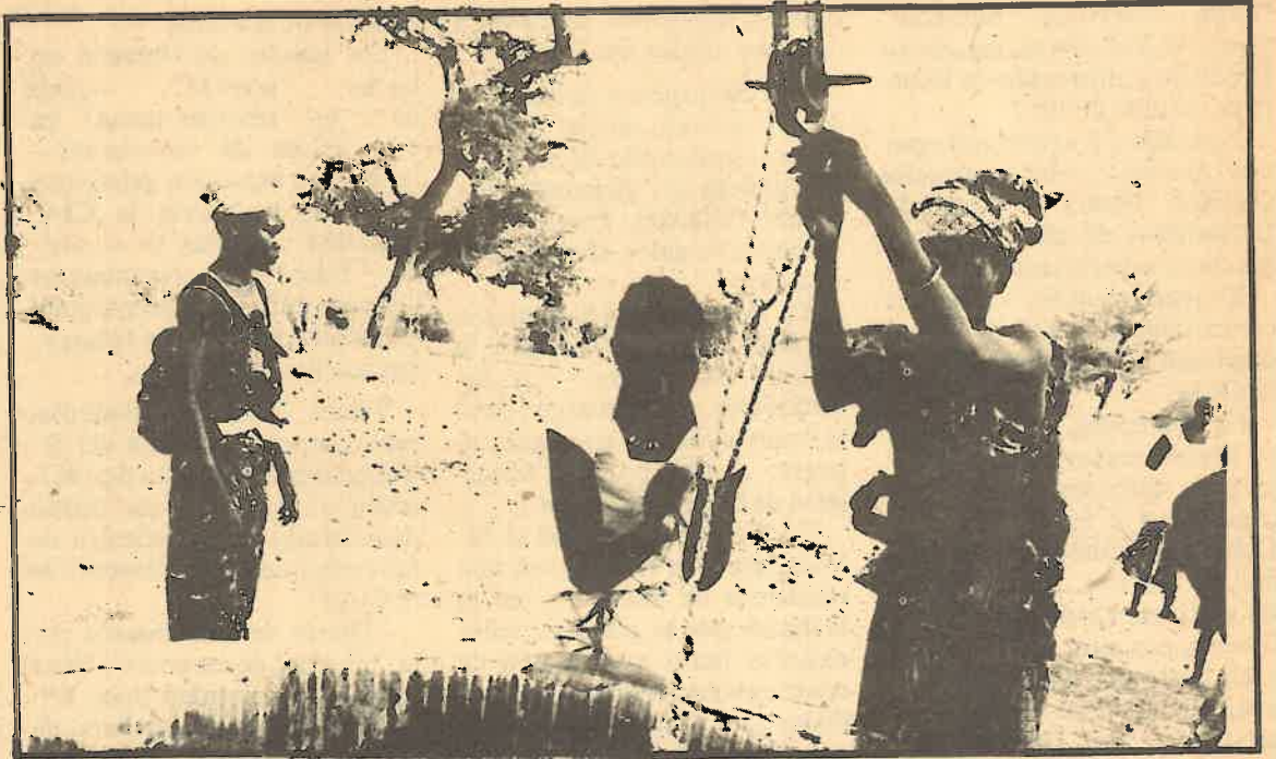
El subdesarrollo consecuencia inevitable del neocolonialismo

Así, entre 1970 y 1978, los EE.UU. obtuvieron, en los países en vías de desarrollo, beneficios del orden de 37,5 billones de dólares, cuando habían invertido el 23% de ese valor. En la década de los 70 las