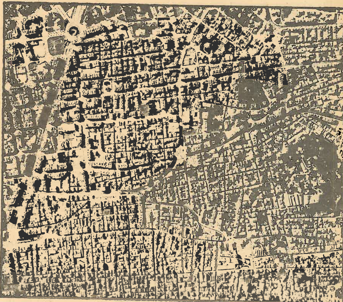
Hay que empezar a olvidar la Barcelona del centro para empezarse a fijar en la periferia.