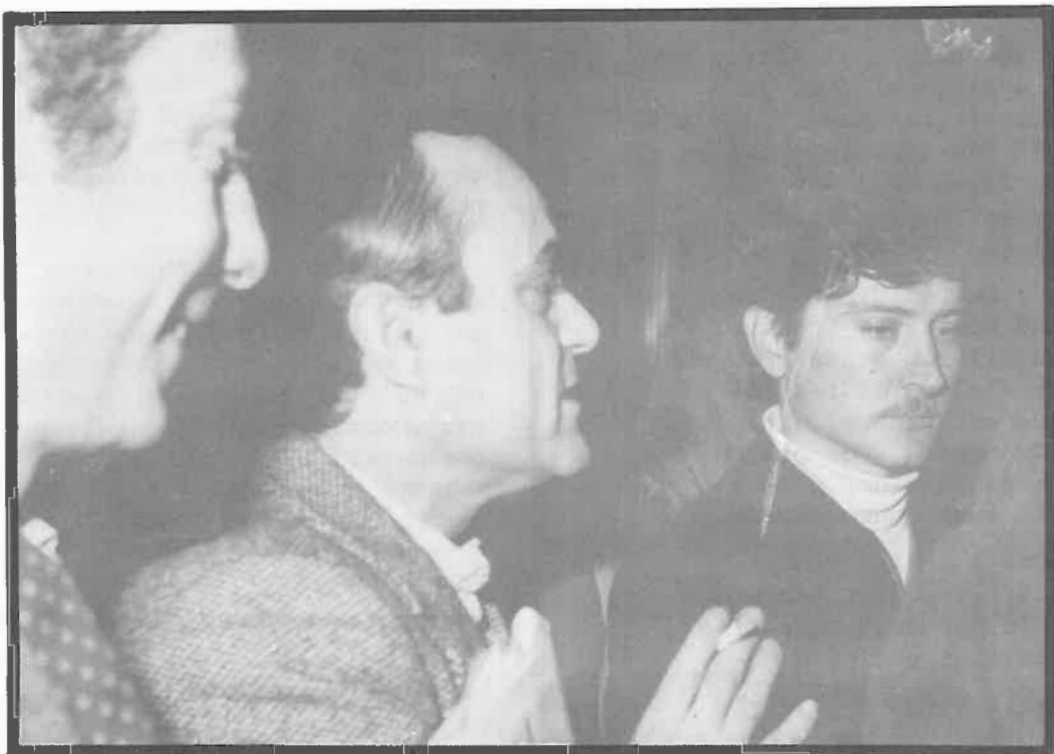
Fuimos a cumplir con nuestra responsabilidad...

El sábado 16 y el domingo 17 se debía celebrar la reunión del Comité Central (C.C.) del P.S.U.C. Dicha reunión no se realizó. Lo que si se efectuó fue una reunión antiestatutaria y fraccional de una parte del C.C. Los acuerdos que hayan podido adoptar no son vinculantes para las Organizaciones del Partido.