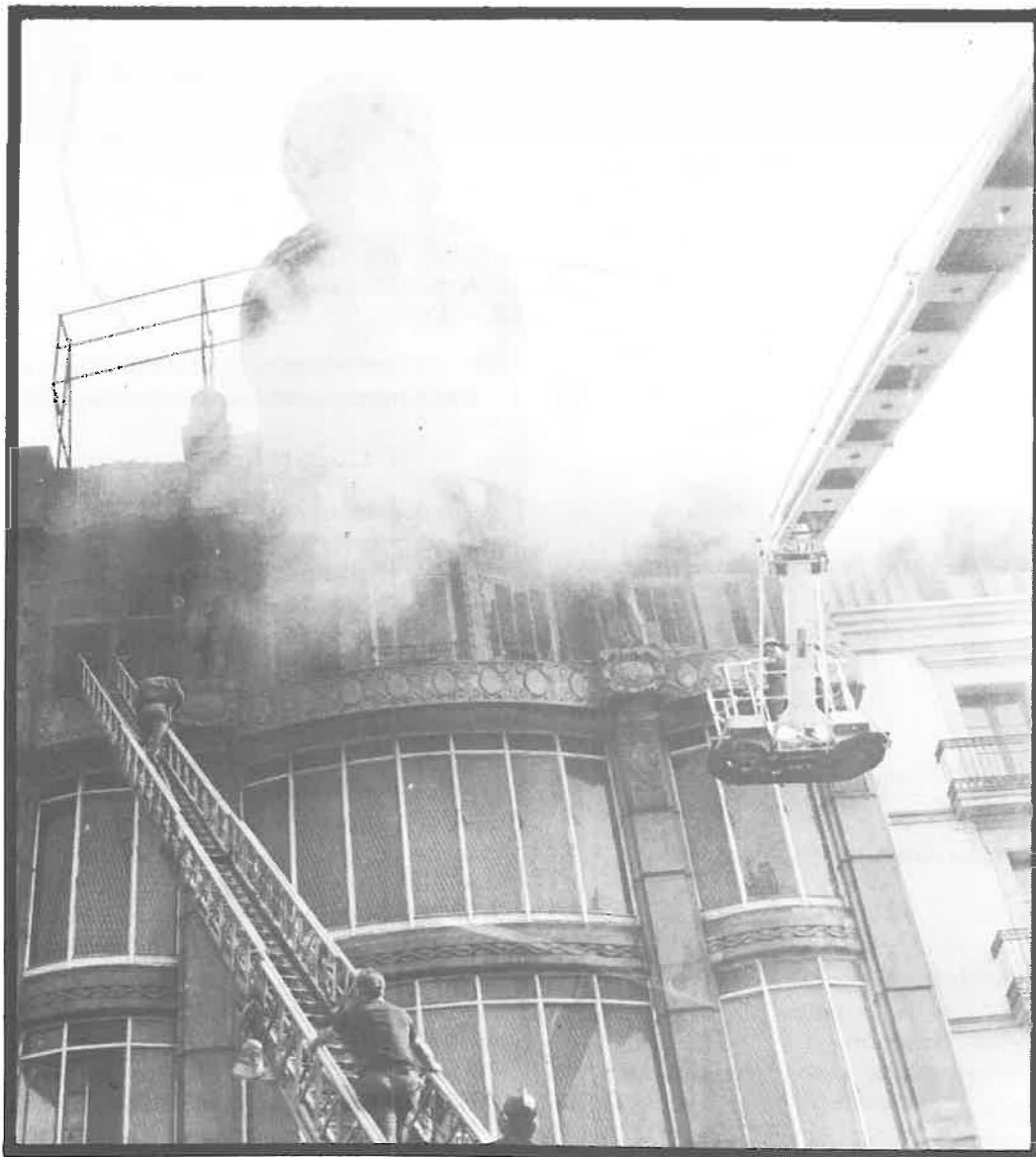
En 1979, un incendi quasi va destruir "El Siglo"

Des d'aquell moment, i fins el dia 24 de desembre en que es va arribar a un acord, els treballadors permaneixen a la porta de l'Empresa dia a dia, sense defallir ni un moment, informant els ciutadans amb fulls, megàfons, propaganda diversa, i sobretot, suportant les contínues denúncies judicials, provocacions, l'esquirolatge i tota mena