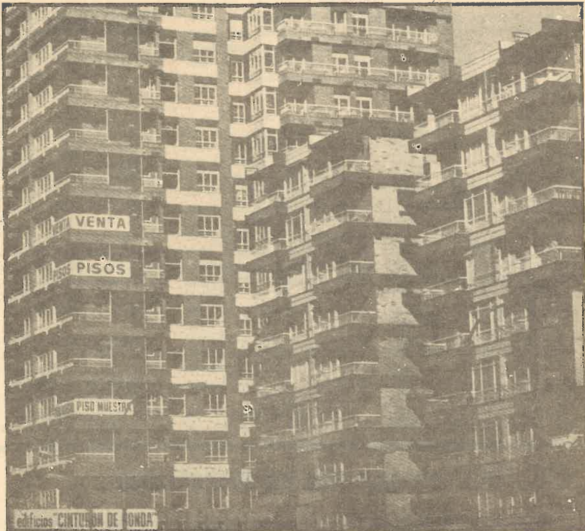
La "invasió" dels altres municipis ha donat aquest producte.

Oposar-se a aquest projecte per a Barcelona, que ignora l'interès de la majoria dels seus ciutadans, és oposar-se al