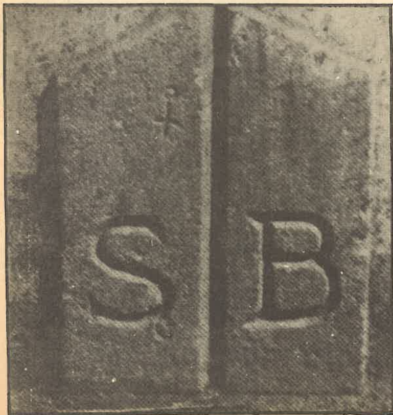
Antiga fita indicadora dels límits entre Barcelona i Sants.