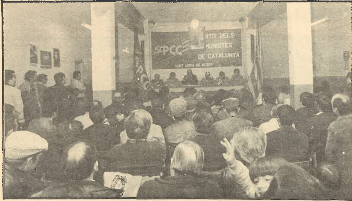
Aspecto del acto de renovación de carnets en Sant Adrià de Besòs.

Más de 40 actos de renovación de carnets hemos contabilizado durante el pasado fin de semana con una variedad de formas en cuanto a su organización y realización, pero la inmensa mayoría de ellos enmarcados en la idea común de la consolidación y extensión del Partido y la proyección pública de éste. En los casos en que esta idea ha predominado con fuerza, los resultados han sido más positivos. No ha faltado tampoco el polo opuesto, aunque constituyen situaciones muy específicas y excepcionales en los que el enfoque ha sido puramente administrativo, es decir, rellenar la nueva cartulina sin preocuparse ni tan siquiera de hacer una buena convocatoria al conjunto de