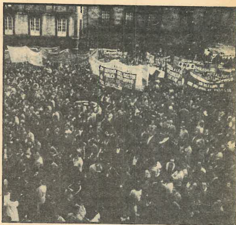
Miles y miles de trabajadores asturianos se manifestaron contra la crisis.

¿Qué es la Corriente Sindical de Izquierdas? Es el agrupamiento de los sindicalistas expulsados de CC.OO., por la corriente eurocomunista dominante en el sindicato, de manera ilegal, incluso sin pro-