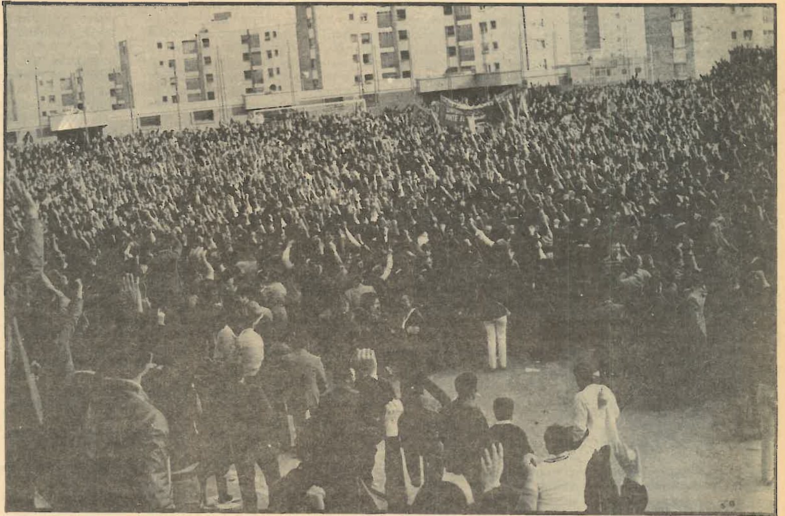
En el debate sindical que se ha abierto en torno al Acuerdo Interconfederal, los trabajadores han de rechazar el pacto alcanzado entre la patronal y la cúpula de los sindicatos.

El elemento más relevante de la situación política de esta semana está en la firma del principio del Acuerdo Interconfederal entre la patronal y las direcciones sindicales. Lo negativo de dicho acuerdo para los intereses de los trabajadores es evidente para cualquier trabajador que haga una lectura del documento de preacuerdo logrado tras varias semanas de tiras y aflojas, de negociaciones oficiales y extraoficiales (es noticia la existencia de una mesa negociadora no pública, que intentaba encontrar elementos de acuerdo, mientras públicamente se hacía la representación en torno a la posibilidad del rompimiento).