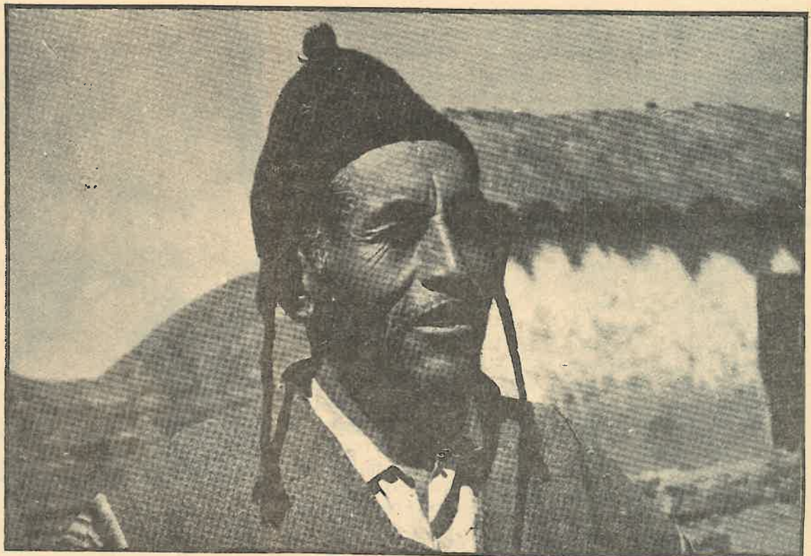
El campesino boliviano, víctima propiciatoria de todos los dictadores que han sometido al país.