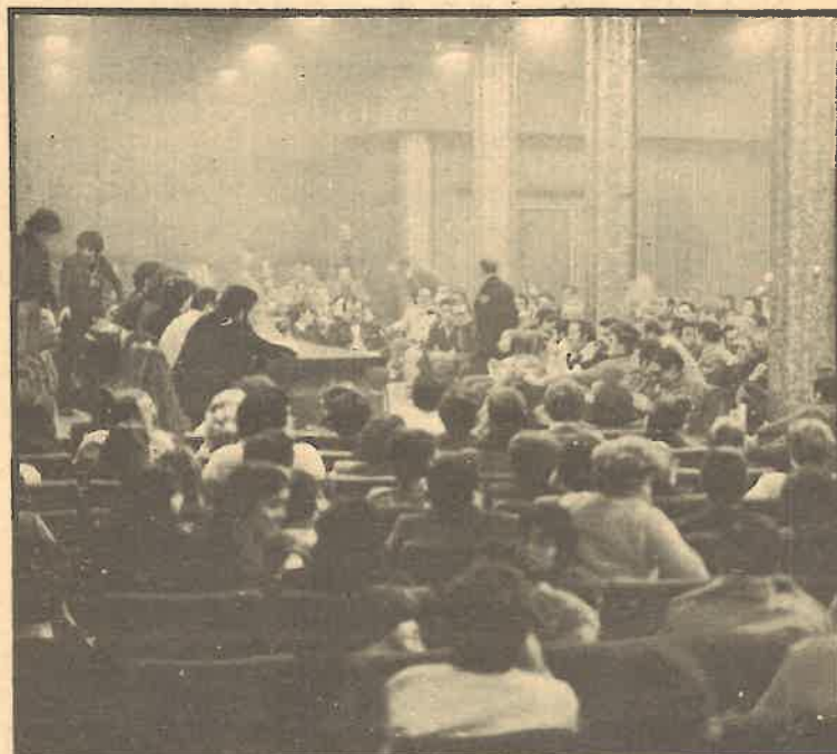
Aspecto de una asamblea de trabajadores de la Administración Pública.

Es evidente que en el marco de la reforma la Administración para ser eficaz tiene que dotarse de unos trabajadores que trabajen, pero no avanzaríamos en este proyecto si se contentaran sólo con controlar su existencia. La Administración tiene que dotarse de unos mecanismos (distintos según el organismo de que se trate) para controlar el resultado del trabajo. Es evidente que previamente se habrán tenido