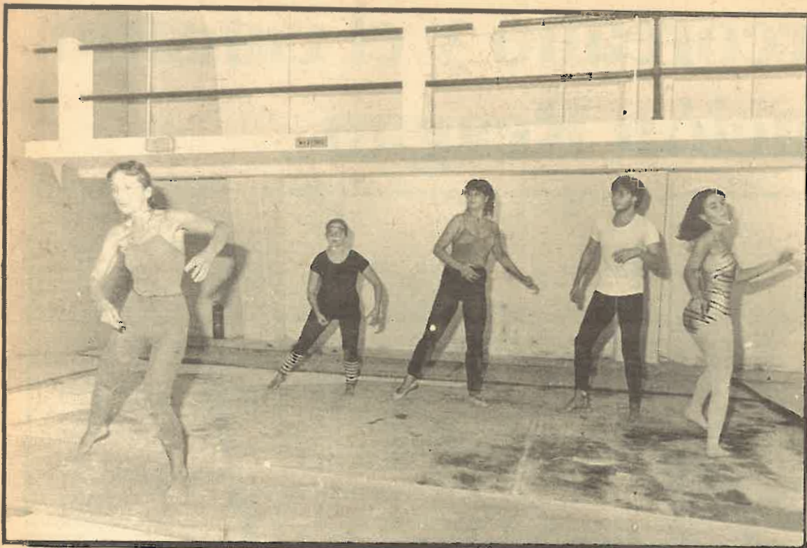
A dos mesos vista que es fessin les primeres reunions per a engegar les activitats dels Grups d'Acció Cultural (GAC), ja el primer Grup, el de Dança i Expressió Corporal, està assajant intensament per presentar-se a la Festa d'Avant amb el montatge "Y no habrá pañuelos de seda..." amb textos de García Lorca, León Felipe, etc. i música de "Aguaviva".