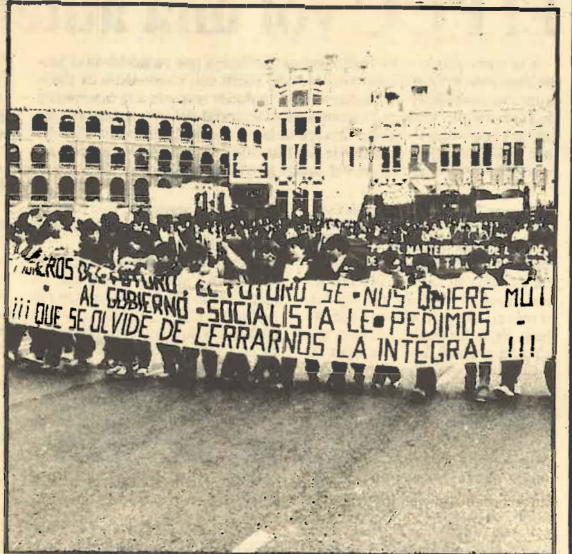
La presión de los trabajadores de Sagunto, obligó a la comisión de Seguimiento a reunirse.

Es por esto que es fundamental que siga la recogida de firmas, porque ahora ya no se trata de alcanzar una cantidad determinada para poder presentar una interpelación en el Parlamento, sino rebasar con creces las necesarias para demostrar al Gobierno que los trabajadores de Sagunto cuentan con el respaldo de todo el pueblo.