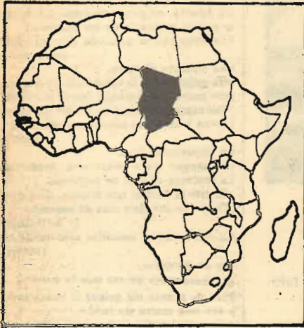
La situación geográfica del Chad, con fronteras con Libia, Nigeria, Níger, Camerún, República Centroafricana y Sudán y con terrenos ricos en uranio, hacen que sea una presa que el imperialismo quiere conservar dominado a toda costa.

Apenas transcurrido un año de haber establecido un gobierno dictatorial en Njamena, capital del Chad, el cabecilla Hissene Habre, sostenido por Washington y otros intereses imperialistas, tiene que hacer frente a la lucha liberadora encabezada por las fuerzas del GUNT (Gobierno de Unidad Nacional de Transición) presidido por Goukouni Queddei. El GUNT representa a todas las fuerzas democráticas y antiimperialistas.