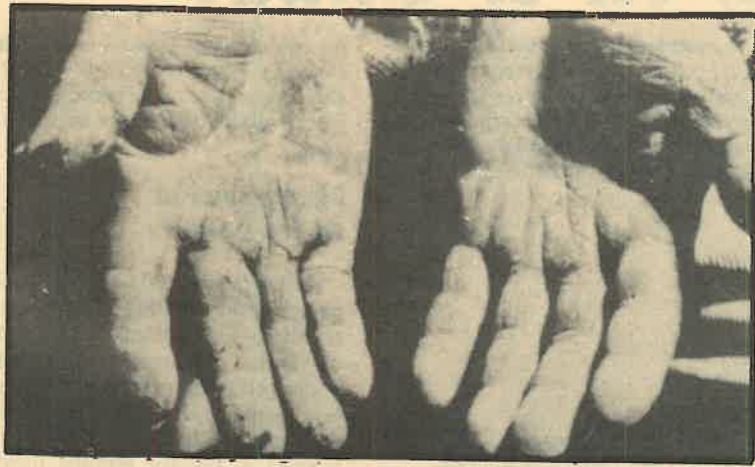
Las manos de Víctor Jara fueron trituradas por la represión.

Mientras tanto la memoria de Allende ha sido capturada por quienes pretenden usarla cínicamente como excipiente de su poder o de sus ambiciones. A las conmemoraciones fáciles de Allende sí acuden estos pescadores de ribera, a cobrar una pieza fácil y sin compromiso mayor; a bautizarse con sus aguas, pero escurridas; a hacerse un salvoconducto con el papel maltratado de una historia mal contada. Porque de ese Allende ceremonial a que acostumbra socialistas tibios se ha excluido casi el gran dato que convierte en doblemente válida la celebración: que Allende murió con la metrallita en la mano, que supo que la cali-