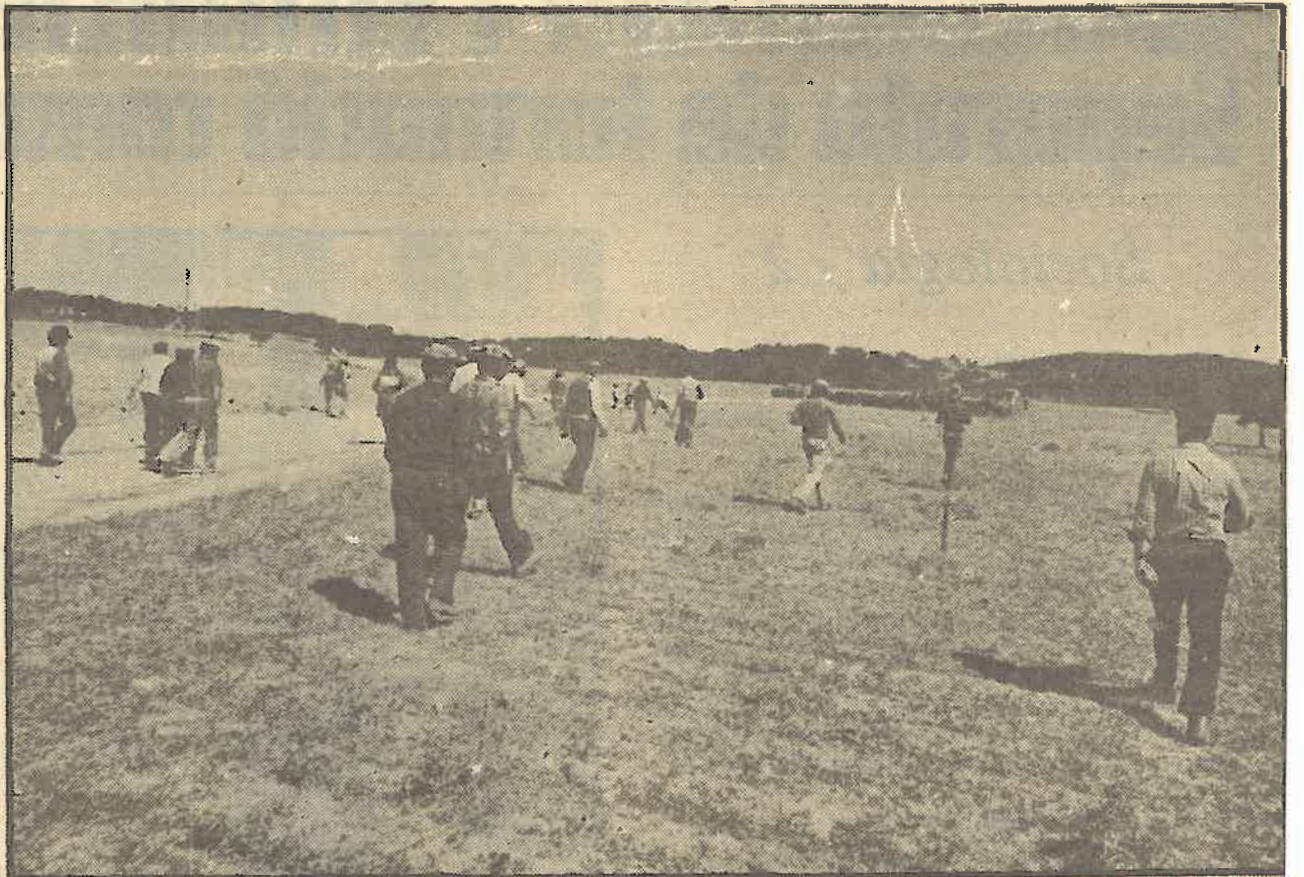
Tierras andaluzas sin cultivar y jornaleros con sed de tierra.

Y ahora, cuando la crisis generalizada del modelo de expansión capitalista hasta hoy vigente hace innecesaria