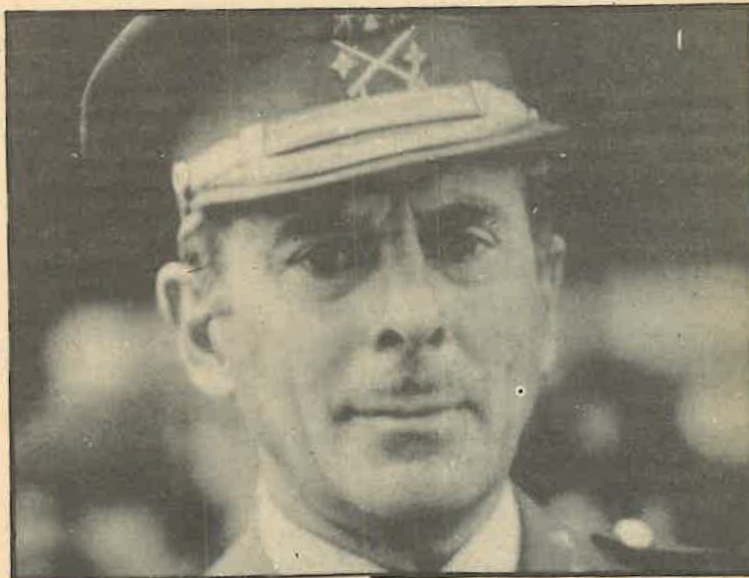
Soteras: ¿un hecho aislado, o un eslabón más en la cadena desestabilizadora?

Qué hacer frente a esta situación, sabiendo que las manifestaciones de Soteras no son más que una muestra de la mentalidad de la mayoría de sus compañeros. Ante todo, situar en todos los puestos claves de mando a militares resueltamente demócratas, y única y exclusivamente