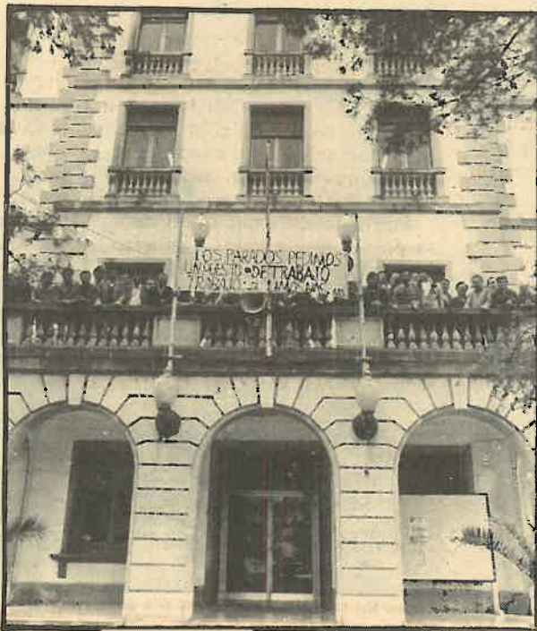
Trabajo, y no la limosna del "comunitario", piden los obreros.

El campo andaluz, como es bien sabido, y a diferencia de lo que ocurre en otras regiones de España, está sometido a un régimen de gran desigualdad en el reparto de la tierra: el 50% en manos del 2% de las familias. Las razones de ese latifundismo escandaloso se remontan a los últimos siglos de la reconquista castellana contra los moros. Del siglo XIII al XV, y empezando por Fernando III "el Santo", los reyes de Castilla, para vencer a la nobleza cristiana de que participara en la guerra, ofrecieron grandes extensiones de tierra, como botín, a los que colaboraron en el despojo de los moros de Córdoba, Sevilla, Málaga y Granada. En cierto sentido, los actuales jornaleros andaluces son los herederos sin herencia de aquellos moros desposeídos de sus tierras por la fuerza de las armas.