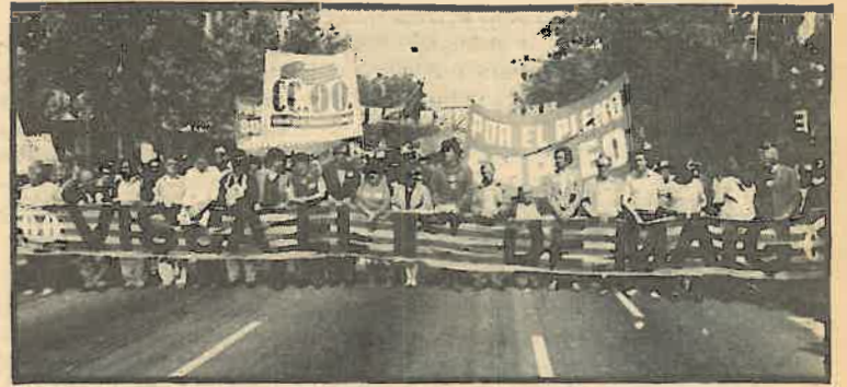
Siguen las movilizaciones por las 40 horas.

La Federación considera que aunque es importante defender la aplicación de la Ley 4/83, es mucho más importante conseguir que el tiempo de descanso o bocadillo, sean de 15', 20' o 30', sea considerado como tiempo efectivo de trabajo. Será la única forma de conseguir que la Jornada de Trabajo sea de 40 horas".