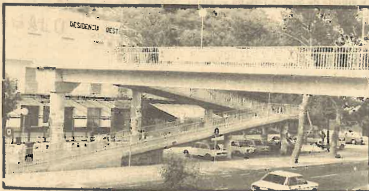
Hay que impulsar la campaña por la paz y el desarme. Castelldefels es un ejemplo.

3º Festa d'Avant. Próximo ya el 14 de octubre, entramos en el período del acelerón en su preparación y popularización. Una parte importante del éxito va a venir determinado por el trabajo militante del conjunto de los camaradas, tanto en