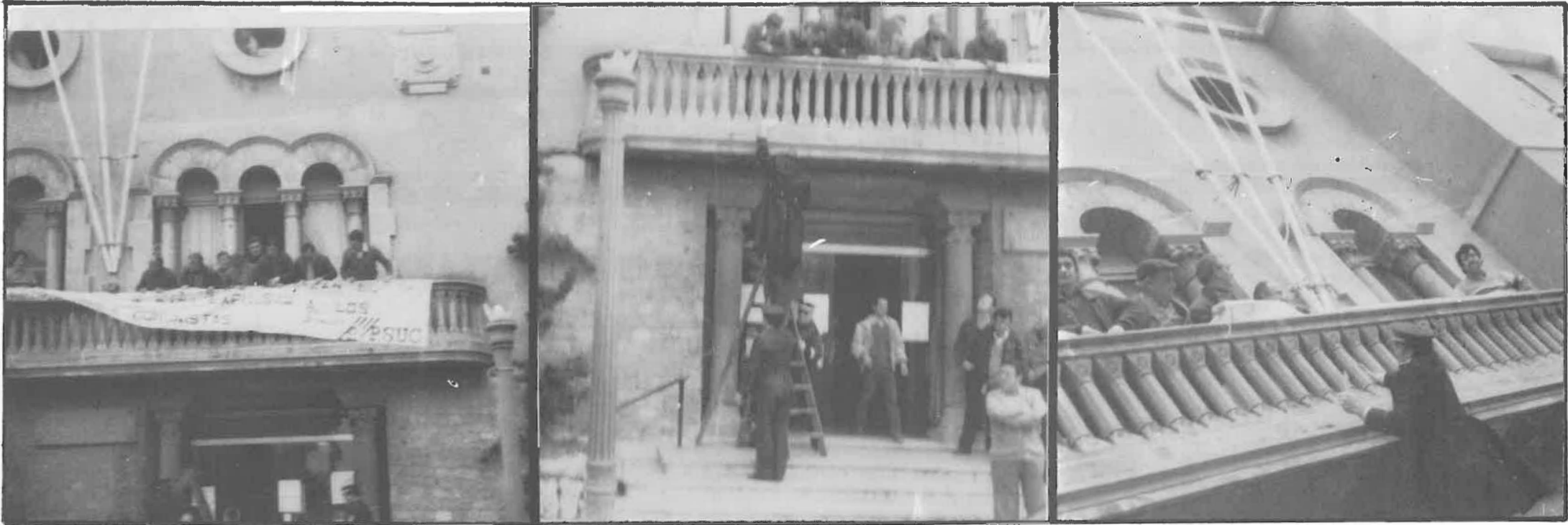
El alcalde euro de Cornellá hizo intervenir a la Guardia Urbana contra concejales comunistas elegidos por el pueblo. En el interior del Ayuntamiento, pistola en mano. En el exterior, como se aprecia en esta secuencia fotográfica, intentando arrancar una pancarta informativa. ¿Dónde está la democracia euro? Mucha crítica a los países socialistas de cara a la galería y mucho autoritarismo en sus propias actitudes. ¿Y si mandaran ellos?