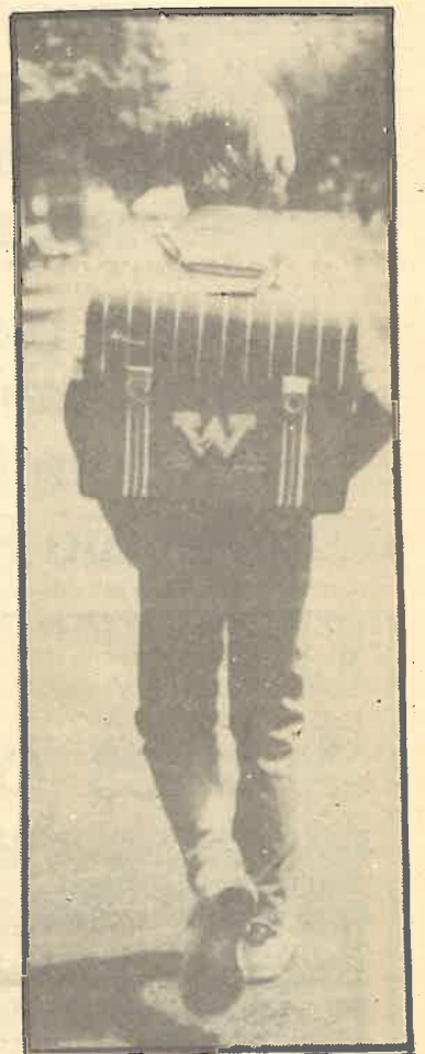
En las luchas actuales de los jóvenes estudiantes se juega el futuro universitario de los niños de hoy.

Los jóvenes comunistas tenemos mucho que hacer en este terreno; el trabajo y la militancia de los CJC en los centros de estudio queda enmarcado en los objetivos generales que se plantea la organización, definidos en los acuerdos de la IX Conferencia: movilizar y organizar a los jóvenes en defensa de sus derechos, fortalecer los CJC. Se trata pues de abordar el trabajo en el movimiento estudiantil de forma organizada, crear donde ya sea posible colectivos de los CJC y, en cualquier caso, plantear la necesidad de organización y por tanto de representación estudiantil: que se elijan representantes de clase y de centro, participando estos últimos en la Coordinadora, potenciar también organismos participativos de base, comisiones culturales, revistas, cine clubs, etc. El objetivo es claro: organizar, buscando participación a nivel de centro y dotar al movimiento de una estructura de coordinación y repre-