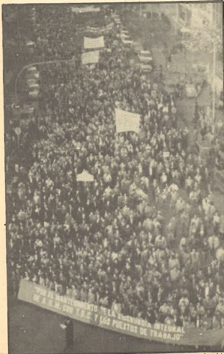
La movilización obrera y popular es el único antídoto contra el paro y la crisis.

Ante la celebración del 8 de marzo, Día Internacional de la Mujer Trabajadora