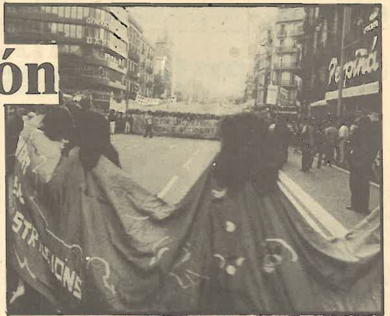
La mujer lanza una jornada de lucha por sus derechos.