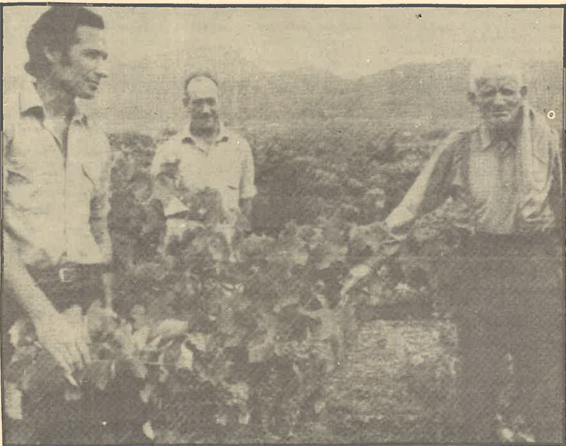
La vid española será una de las primeras víctimas del agro si nuestro país ingresa en el Mercado Común.

da, Bélgica, etc., penetrados por el imperialismo de los USA, se van poniendo de acuerdo para la consolidación de un capitalismo imperialista que no sólo explote a la clase obrera de sus países, sino que también reciba las plusvalías de los neocolonias y países dependientes. Su primer logro: la CECA (Comunidad Económica del Carbón del Acero). Es decir, la puesta en conjunto de dos recursos fundamentales para el desarrollo de una industria básica al servicio de los Krupp de siempre. Y mientras tanto, España pone los pilares de su desarrollo —aconsejada por el Fondo Monetario Internacional, el Banco Mundial y la OCDE— en la importación masiva de petróleo. Este mismo petróleo que empezamos a demandar en grandes cantidades, abandonando nuestra miseria, por consejo "de ellos", y que ahora tan caro estamos pagando. España tenía que suministrar barcos, acero, calzado, vino y sol a todos los países industrializados. Así nos querían. Y así no nos quieren ahora. Sólo nos queda lo del sol —turismo barato para pensionistas de la Alemania Federal—. Estalló la crisis más grave del capitalismo, y "ellos" se habían olvidado de las