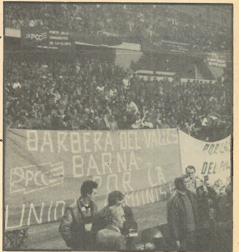
Llamada para un apoyo total a las candidaturas del PCC. En la foto, nuestro partido está presente en el Congreso de Unidad.

Y finalmente, el CC ha estructurado el trabajo de la dirección del Partido, atendiendo a la necesidad de que cada uno de sus miembros, además de militar regularmente en su célula, desempeñe el papel dirigente que le corresponde y participe del conjunto de