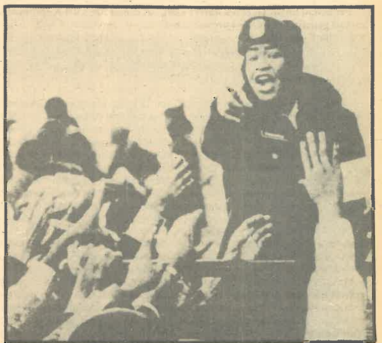
Miles de obreros norteamericanos se movilizaron para la consolidación de trescientos puestos de repartidores de correos.

Nosotros propondremos el pase a propiedad pública y la nacionalización de industrias básicas tales como la siderurgia y la automoción, los ferrocarriles, los servicios públicos, las compañías aéreas y todo el