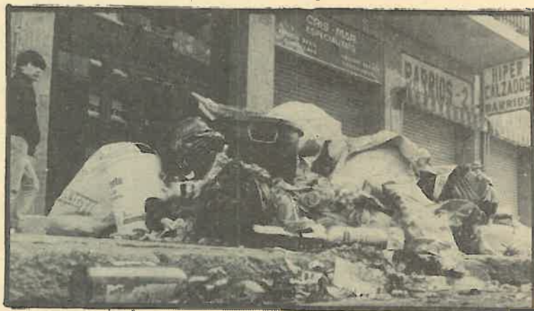
La basura qued  sin recoger en Sabadell.

La huelga, que dur  8 d as, vale la pena darla a conocer, saber el proceso y el resultado y el c mo una plantilla de 109 trabajadores decide por unanimidad pr cticamente, ir a la huelga y de igual manera la dan por acabada.