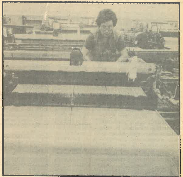
El textil, víctima de otra cacicada de los euros en CC.OO.

Hay que señalar en la grave irresponsabilidad en que incurren quie-