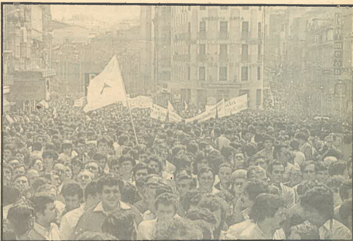
Sólo la movilización obrera llevará adelante la lucha contra la reconversión industrial y por una reindustrialización que cree nuevos puestos de trabajo. Las manifestaciones en Vigo, como la que muestra la fotografía, son un ejemplo.

Solo con la movilización masiva podremos cambiar la política antiobrera del gobierno PSOE