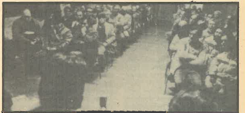
Un aspecte de la reunió en la que se rindió homenaje a los militantes veteranos del PCC.

menys, un mer tràmit burocràtic administratiu, sinó el reconeixement del conjunt del Partit a uns militants