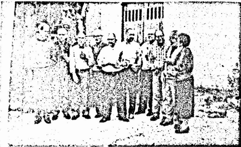
Junta de la Vocalía de enterramientos compuesta de tres Asociaciones de vecinos La Creu Barberá, Termes y Sol i Padris.