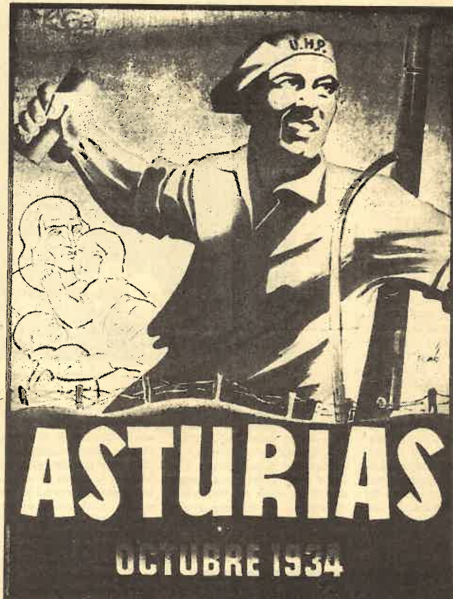
Buen comienzo de la conmemoración de la revolución de Octubre de 1934.