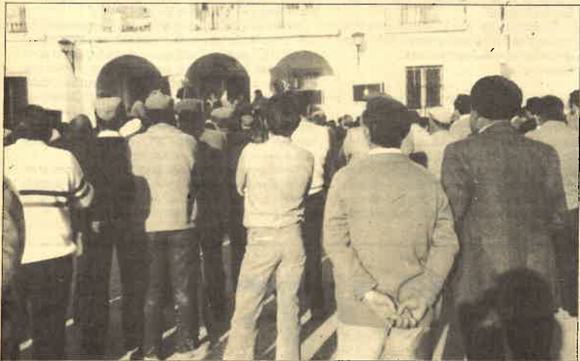
En la plaza de Pruna escuchando a Ignacio Gallego.