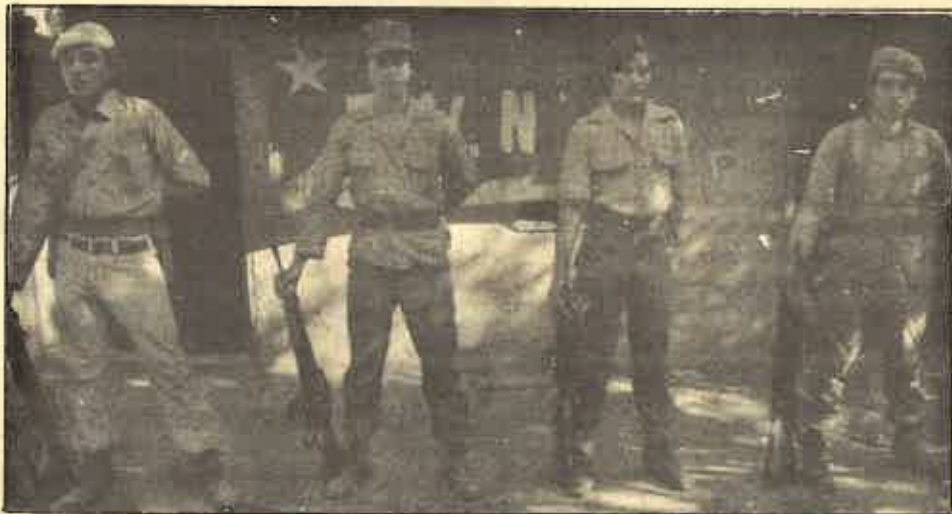
Guerrilleros del Frente Farabundo Martí de Liberación Nacional, grandes ausentes de los comicios.

Sólo los gobernantes de los EE.UU. y algunos de los líderes europeos entre los que hay que incluir a los nativos de PNV y AP, ligados a la democracia cristiana junto con, naturalmente, los círculos económicos que sustentan la política de agresión constante del imperialismo norteamericano hacia los pueblos que luchan contra la opresión colonialista y por su independencia, podrían encontrar en los candidatos arriba mencionados a los garantes de unas elecciones libres y democráticas y a los propiciadores de las condiciones necesarias para acometer la tarea de la reconstrucción nacional salvadoreña. Mientras tanto, el pueblo salvadoreño conoce a sus enemigos y sabe donde están sus auténticos defensores. El F.M.L.N., a su vez, va entrando en una fase de fuerte consolidación política de sus avances militares logrados. Se percibe con claridad un proceso imparable de construcción de un poder popular alternativo al gubernamental en las zonas de reciente control del F.M.L.N. así como la consolidación de esos poderes en sus retaguardias tradicionales.