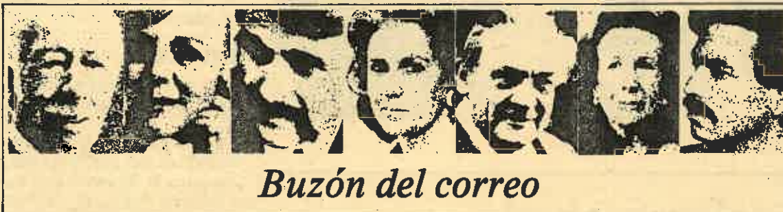
Buzón del correo

Mi situación actualmente es de militante que no milita; me explico: tengo el carnet —como antes dije— pero no milito, a parte de que aquí hay poco movimiento por parte del partido,