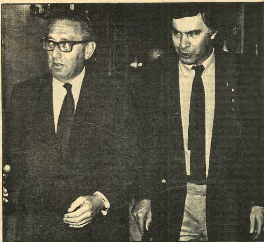
¿Coincidencia de intereses?