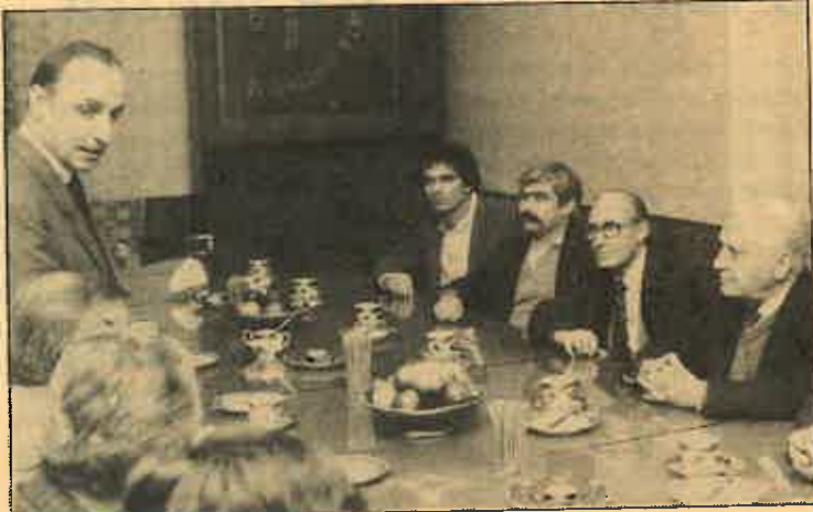
Los miembros de nuestra delegación reunidos con la dirección de la empresa Fut, fabricante de maquinaria

El MPRN, después de haberse constituido en el I Congreso, alcanzó la sustantividad jurídico-constitucional, ya que la Constitución de la República Popular de Polonia establece claramente que la base de este movimiento es, tanto el POUP, como su alianza y cooperación con el Partido Democrático, como, asimismo, su cooperación con las organizaciones sociales que se pronuncian por los principios orgánicos de la RPP. Se trata de un movimiento nuevo, de contenidos nuevos, entre cuyos objetivos a largo plazo se encuentra, fundamentalmente, la superación de la crisis y el en-