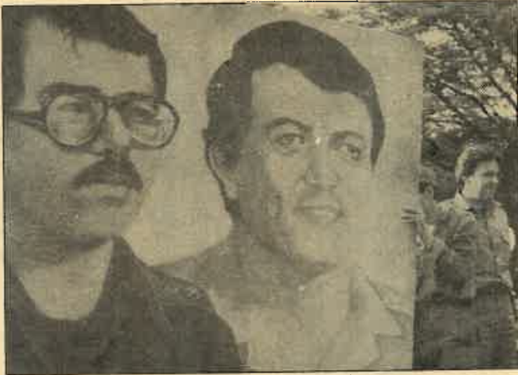
Daniel Ortega, presidente. Sergio Ramírez vicepresidente.

Para el imperialismo ha llegado la hora de confiar exclusivamente en la guerrilla que la CIA ha formado en las fronteras norte sur del país. La autodenominada «Coordinadora Democrática» de Arturo Cruz prefirió no presentarse a las elecciones calculando que jugar a la abstención le podía reportar más beneficios que unos sufragios que sabían ya claramente decantados por la Revolución, la abstención no ha llegado ni al 18%, pese a la cobertura que le ha dado la guerrilla impidiendo que se votara en once colegios de la zona colindante con Honduras, las candidaturas que ha presentado la derecha no han logrado reducir el voto de más de dos tercios por el FSLN. El juego político ha acabado pues para el imperialismo y sus ramas nicaragüenses. Se trata ahora de hostigar militarmente como única vía para ahogar la Revolución. El espejismo de un respaldo popular que probablemente nunca tuvieron se ha desvanecido y les queda sólo la guerra pura y dura.