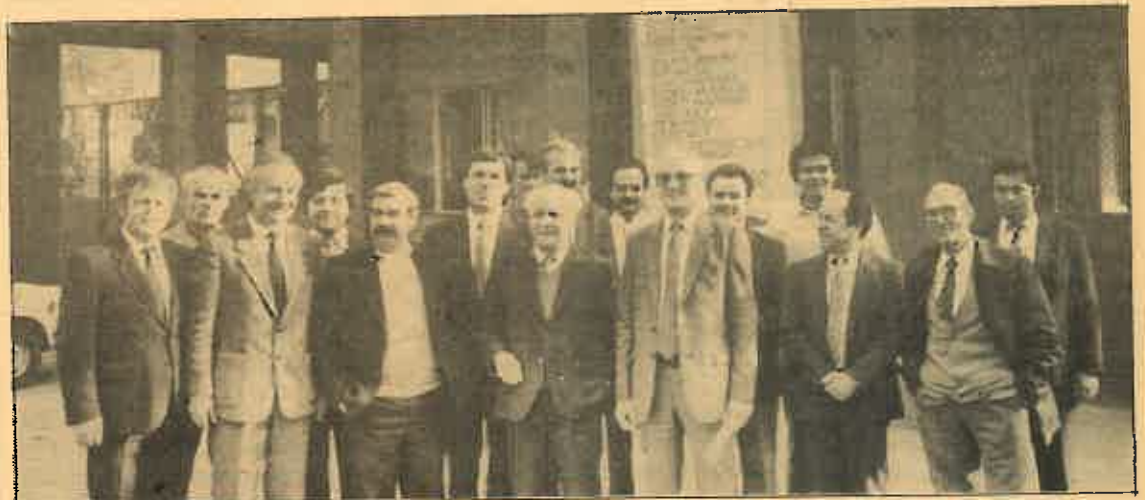
La delegación del PC es recibida a su llegada a la empresa «Chemar».