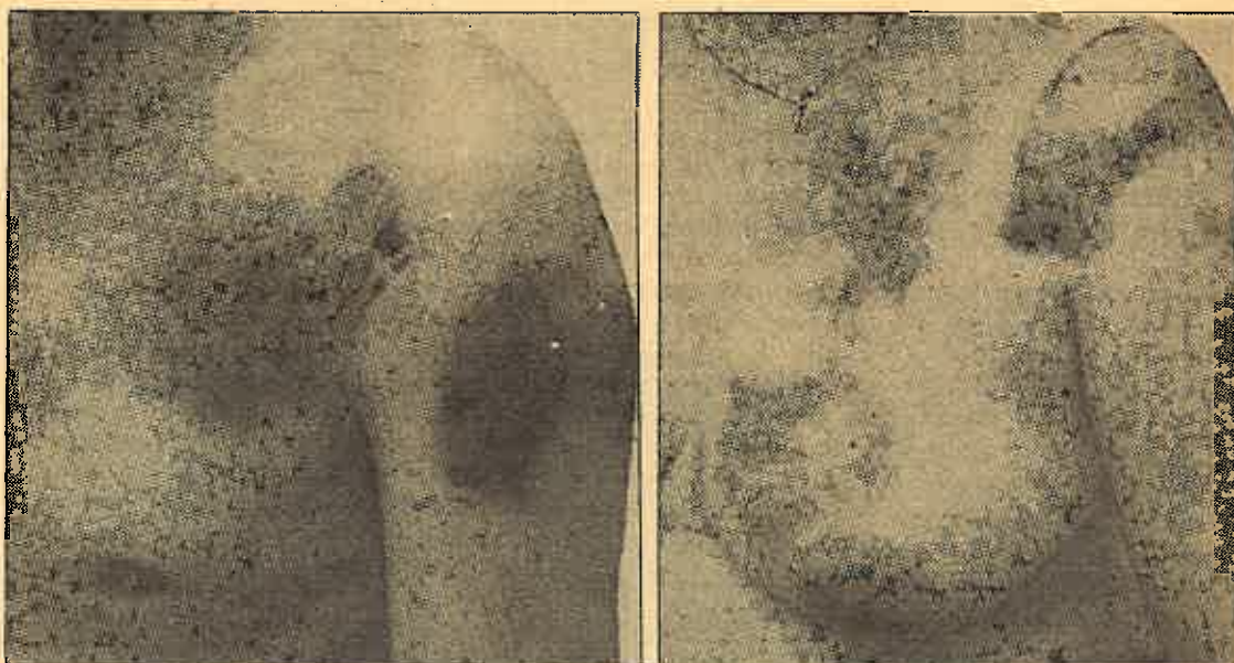
Estos planos corresponden a casos de tortura en España y han sido recientemente publicados por la revista «Cambio 16».

11ª. Los colectivos de médicos y abogados que participan profesionalmente en la asistencia a detenidos o presos están especialmente obligados a denunciar cualquier indicio de tortura o malos tratos y a