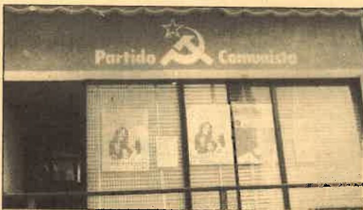
Sede del Partido en Leganés

ganda deben hacer un estudio detenido del entorno de las organizaciones del Partido, organizar actos políticos que nos sitúen entre los trabajadores con las fuerzas de izquierda, por la unidad frente a la derecha reaccionaria. Hay que estudiar la posibilidad de poner más mesas los sábados, domingos y días festivos, y establecer diálogos abiertos con los trabajadores para que nos digan lo que piensan del Partido.