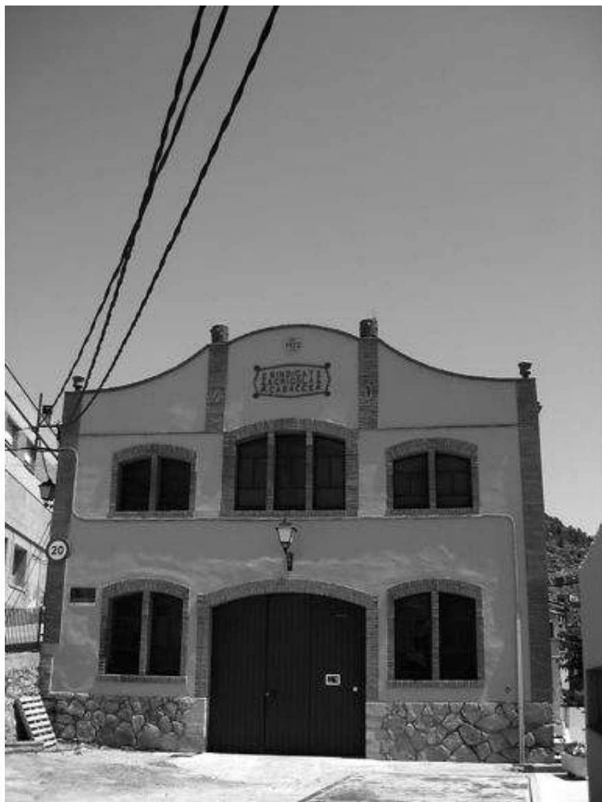
Sindicat agrícola de Cabacés