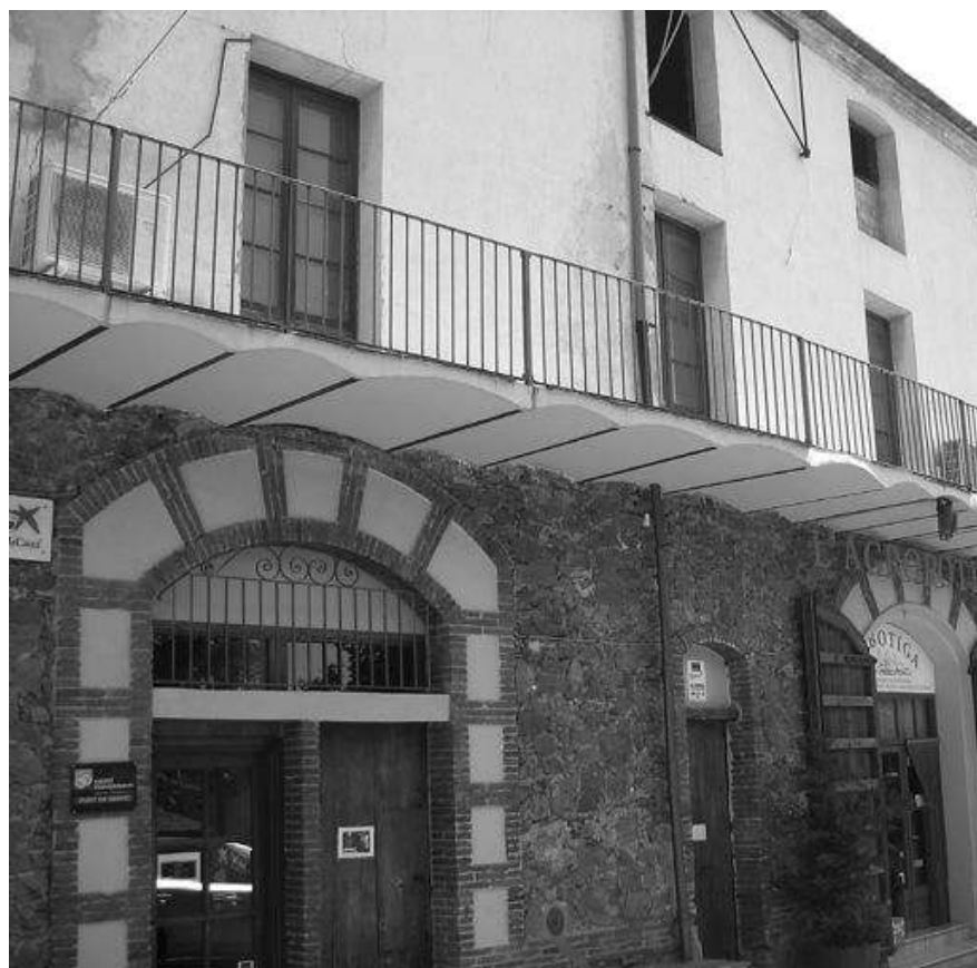
Cooperativa de la Vilella Baixa