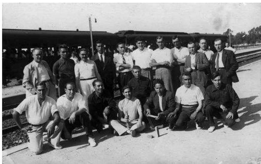
Junta de la Unió de Cooperadors de Torredembarra (1936)