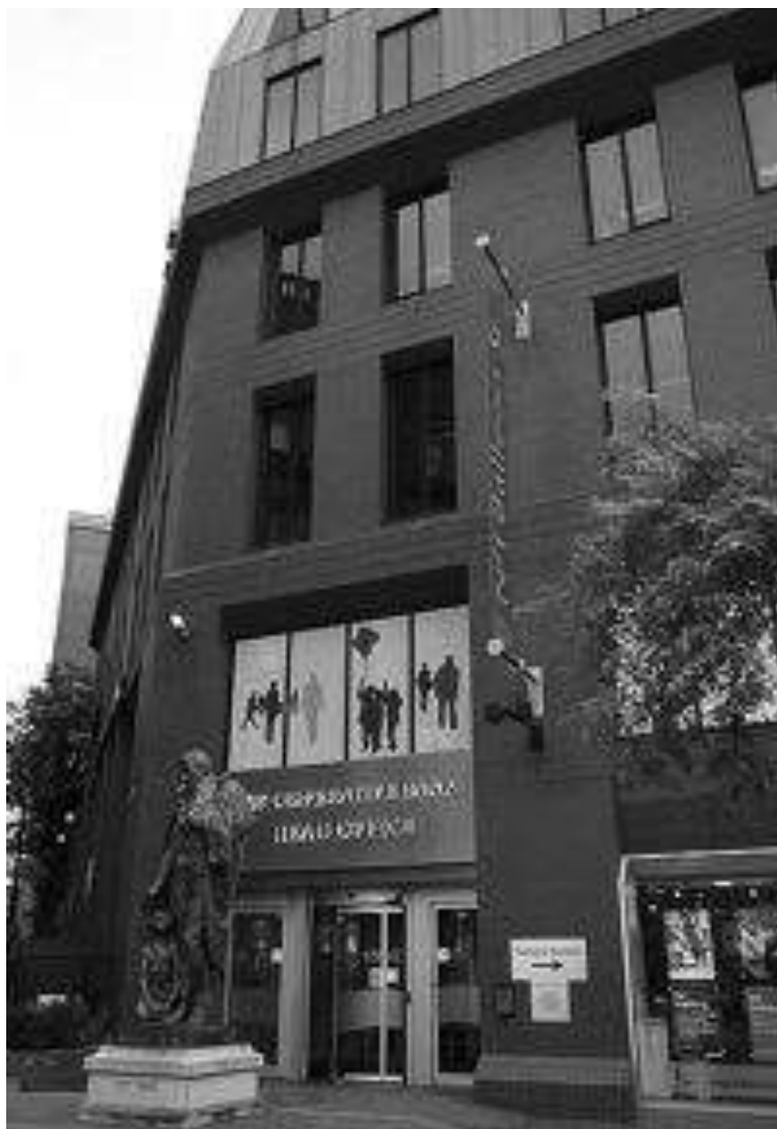
La seu del Co-operative Bank amb Robert Owen davant.