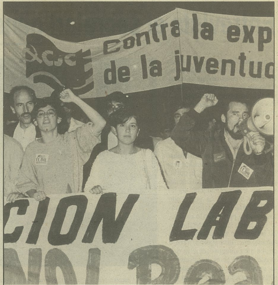
Mobilització contra l'atur

La JC considera que per donar la batalla, en aquest context, cal continuar treballant en l'enfortiment del moviment obrer i sindical, específicament CC OO, i del moviment veïnal. En altre àmbit,