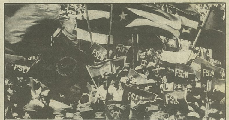
Celebració, a Managua el 1989, del desè aniversari del triomf sandinista

El Comitè del Central del propassat dia 3 de desembre, va comptar amb l'assistència dels responsables de relacions internacionals, de zones rurals i de Managua, de la Juventud Sandinista de Nica-