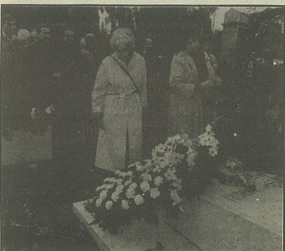
Un moment de l'acte d'homenatge a la Pasionaria, dissabte passat.

Dissabte dia 9 es complia el centenari del naixement d'aquesta incansable lluitadora, exemple i punt de referència obligat de la història de la lluita de la classe obrera a l'estat espanyol, que és Dolores Ibárruri, Pasionaria.