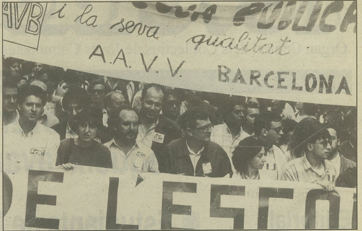
Manifestació en defensa de l'ensenyament públic

La JC planteja la necessitat de lluitar en l'actual sistema educatiu per a transformar-lo, aprofir-