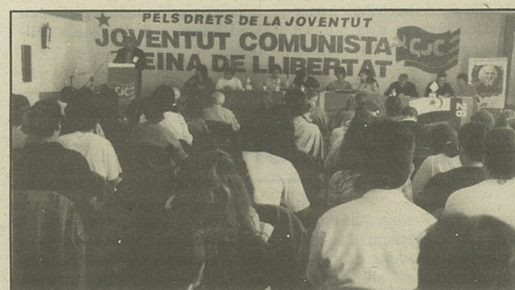
VI Congrés dels CJC