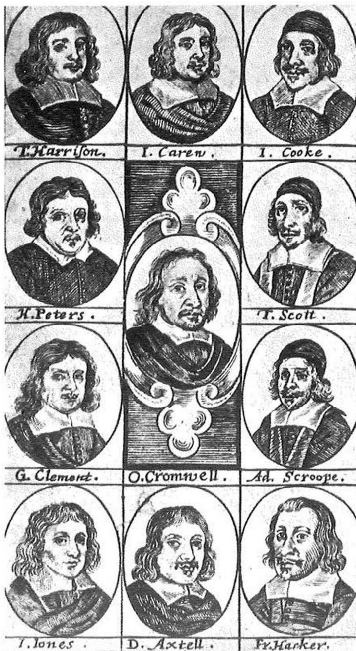
Comité administrativo del Nuevo Ejército Modelo con Oliver Cromwell en el centro Panfleto impreso por el bando realista con una leyenda que dice: Rebeldes no santos