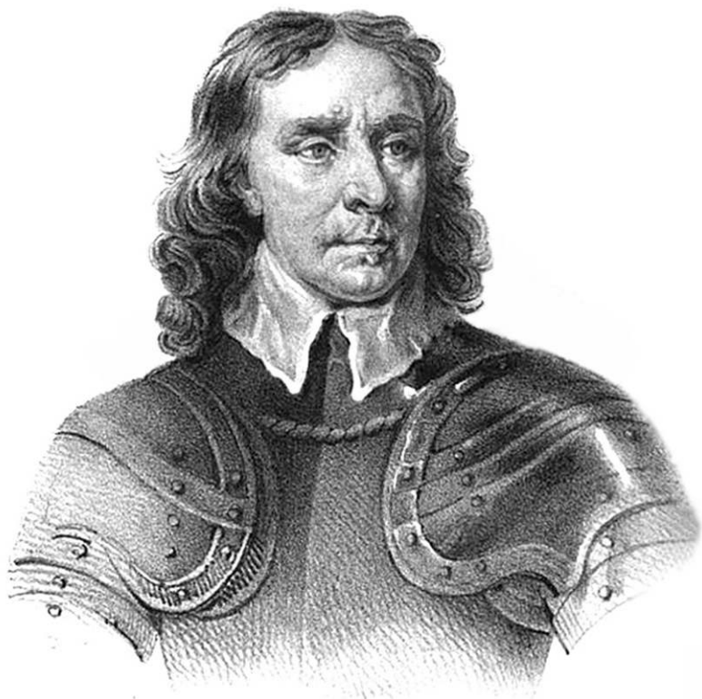
OLIVER CROMWELL, LORD PROTECTOR OF ENGLAND

En otras circunstancias esto hubiera conducido a un régimen despótico y a una dictadura republicana de virtuosismo puritano. Pero gracias a Oliver Cromwell no se produjo, manteniéndose el espejismo de una solución basada en un acuerdo. De hecho, siempre estuvo claro que sólo el fin del gobierno militar y la restauración de la monarquía podrían hacer posible el ansiado compromiso. Idea que estaba presente en la mente de todos.