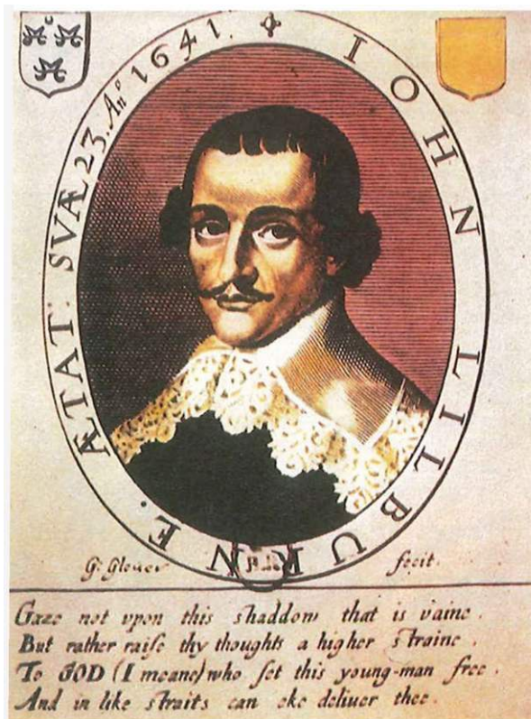
Jonh Lilbume, la personalidad más representativa del bando de los niveladores

En el Parlamento de 1640, el señor Rabb observó que los muchos diputados con inversiones en compañías comerciales eran los que se mostraban más activos en el Parlamento. Pero el poder de la Iglesia y la Corona equilibraban la balanza contra el sector capitalista hasta que la Revolución abolió la Cámara Estrellada y la Alta Comisión , consolidó el control parlamentario de la Iglesia, la política fiscal y exterior y liberó a los J.P. (Justicias de la Paz) de la supervisión del Consejo Privado.